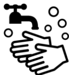
石けんによる手洗い