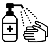
手指消毒用アルコールによる消毒の励行