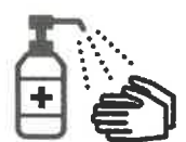
手指消毒用アルコール による消毒の励行