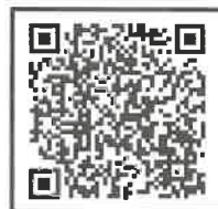
デジタル庁（電子証明書）

※郵送後に発生した新たなお知らせについては、ホームページ等で村民の皆様 に周知致しますのでご確認ください。