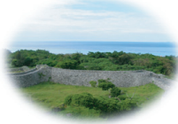
歴史・文化的景観