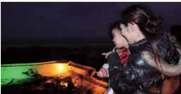
▲城壁を見つめる親子連れ