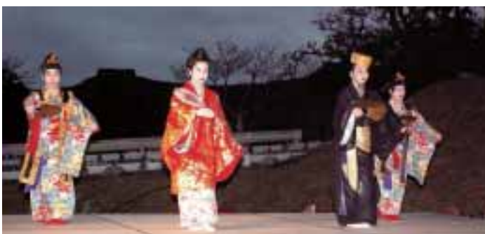
▲点灯式での「かぎやで風」