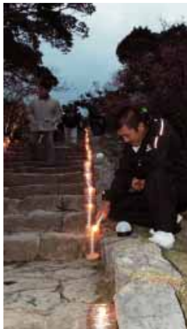
▲「花あかり」のろうそく点灯は、青年会が中心となった

※グスク交流センターにて「今帰仁グスク桜まつり写真展」開催3月9日(日)～4月10日(木)まで