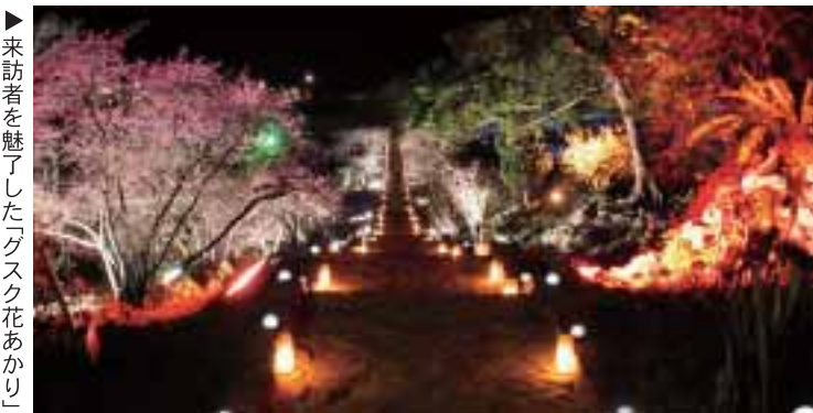
▶来訪者を魅了した「グスク花あかり」

一月十八日のオープニングセレモニー(点灯式)を皮切りに、「第一回今帰仁グスク桜まつり」が二月十日までの二十四日間、今帰仁城跡にて盛大に行われた。 まつり期間中では城壁と桜を幻想的に映しだすライトアップや、参道を優しく照らす「花あかり」など、夜間でも楽しめる催しが行われた。また二月二日、三日にはそれぞれ三回ずつの舞台公演、二月十日には遺跡見学会など多彩な催しが行われ、前年同時期の三万三千七百十五人を大きく上回る五万六千五百五人が訪れ、世界遺産今帰仁城跡の魅力を堪能した。