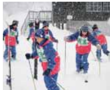
▲ 基本レッスンから…