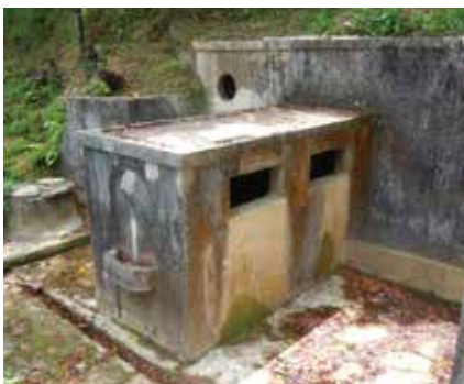
▲ 懇謝堂簡易給水共同井戸

〜懇謝堂のハイカラ井戸〜(天底) バス停「懇謝堂」から湧川向け、左手の畑の側にある四角いコンクリート製のモダンな施設。昭和九年竣工の懇謝堂簡易給水共同井戸です。井戸に降りる階段の門柱、アーチ型に掘られた手洗い場、手前のタンクの四角い窓に対する奥の貯水タンクの丸窓など、デザイン心あふれる井戸です。この井戸の前を通る畑道は