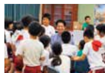
▲自分の夢を仕事にする。カッコいいですよ今帰仁まつりにも来るそうですよ。

今後の目標として「3ヶ月に1回くらいは、村内でも定期的に落語ができてほしいな」と地元での活動も考えているそうです。