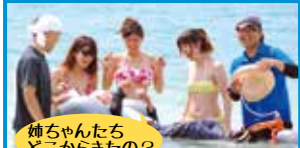
姉ちゃんたちどこからきたの?

小規模多機能型施設SHIGER UI-HOUSEが、施設利用者を対象に海洋療法として車いす(チェアボード)を使った海水浴を行いました。砂浜を利用することで足腰の強化にもつながり歩行機能訓練にもなるとのこと。