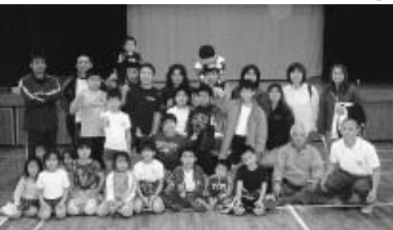
▲やんばるレスリングクラブのメンバーと関係者