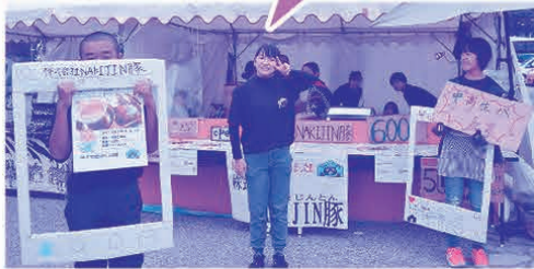
村内の小中学生で設立した株式会社NAKIJIN豚で商品開発(プロデューサー育成事業)