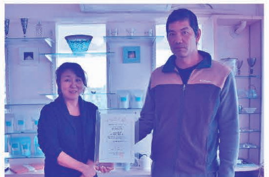
ティールーム「HUALI」の大城夫妻