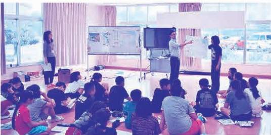
兼次小学校での講座風景