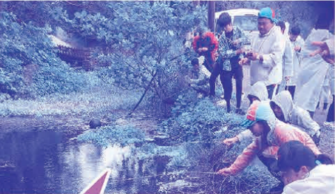
子どもが考えた今帰仁村体験プログラム(キャリア教育)