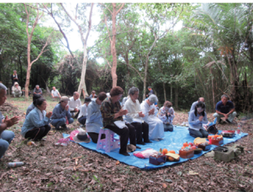
▲ウプユミ(ワラビミチ)の様子(2008年)