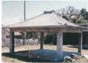
▲神アサギとナカムイヌタキ(平成10年)