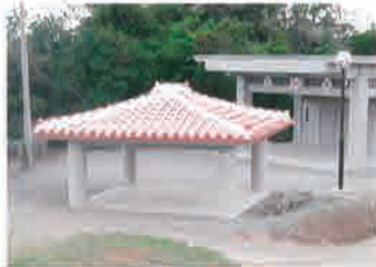
▲新築された神アサギと舞台(平成17年)