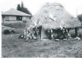
▲茅葺屋根の神アサギの頃の ウシジャミ(昭和30年代)