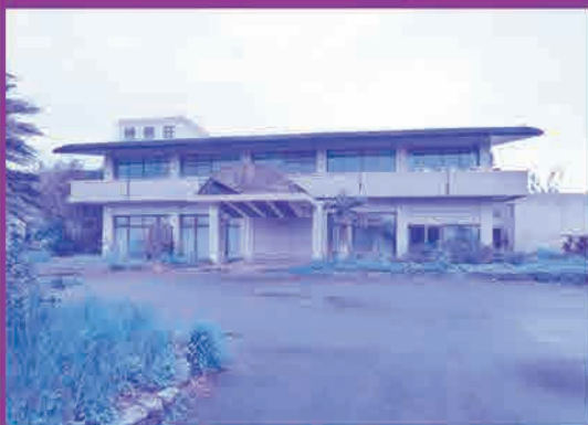
平成26年4月時点 梯梧荘跡地

本村では梯梧荘跡地について、宿泊事業に供 する事業者を対象として一般競争入札(郵便入 札方式)による払下げを実施します。 申込期限: 平成30年8月10日(金) 申込方法: 村ホームページから様式をダウン ロードし、記入後に提出。 ※詳しくは村ホームページにて掲載中。 ホームページ URL http://www.nakijin.jp