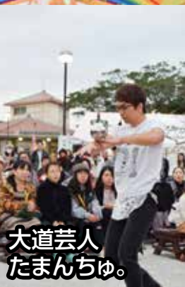
大道芸人 たまんちゅ。