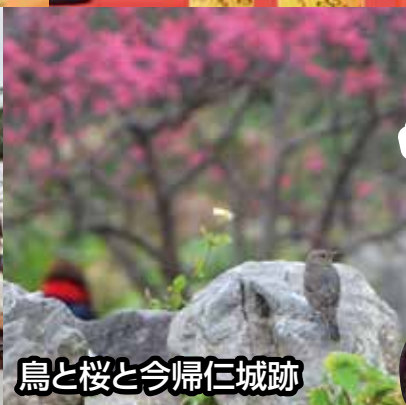
鳥と桜と今帰仁城跡