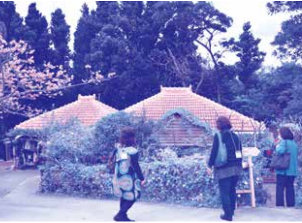
▲ 上間さん宅 風情がありますね〜