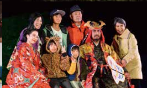
北山王・王妃との写真撮影