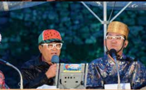
thゴールデンアワー