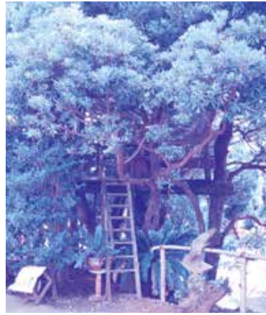
▲ 平安山植木店さんのツリーハウス