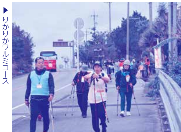
▶ りかりかワルミコース