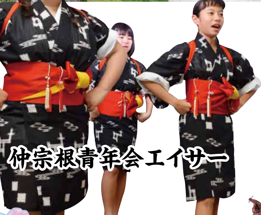
仲宗根青年会エイサー

王・王妃の選出と撮影会の開催、今帰仁村特産物の直売会、琉装体験など幅広いイベントが開催されました。最終日前日には、村内の中高生が起業した株式会社freedによる、1日限りの飲食店が出店され、地産食材を活用した和牛サンドや無農薬野菜のスープなどの販売を行い、今帰仁村のPRに貢献しました。子どもから大人まで地域の方々の協力で桜まつりが開催されています。