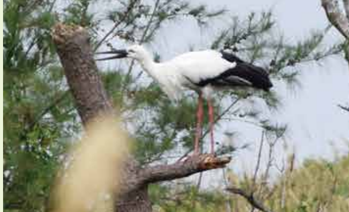
▲羽を休めているのか、1時間程待っても飛んできませんでした

※兵庫県立コウノトリの郷公園に確認済み。コウノトリで間違いないそうです。しかし、野生のコウノトリの判断はつかないらしい。