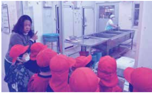
▶ 野菜を洗つところ

「野菜はここで少なくとも3回は洗います」「このお玉二回で2リットルすくえるんだよ」など、子ども達は給食センターの職員の説明を真剣な表情で聞いていました。