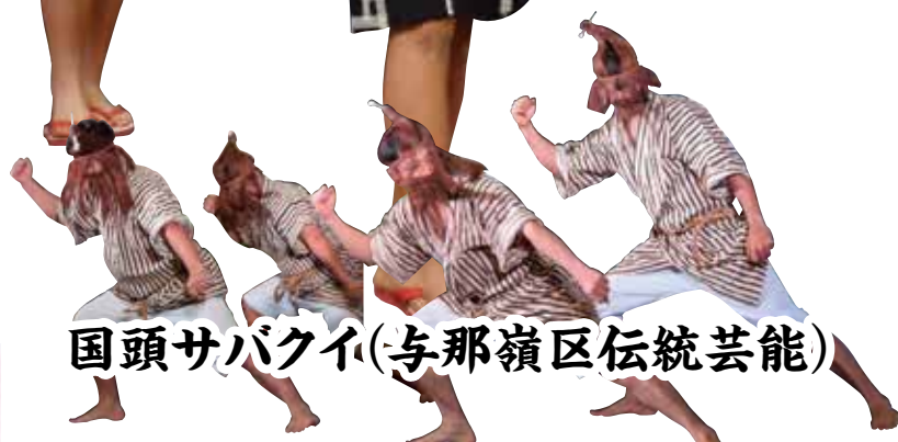
国頭サバクイ(与那嶺区伝統芸能)

王・王妃の選出と撮影会の開催、今帰仁村特産物の直売会、琉装体験など幅広いイベントが開催されました。最終日前日には、村内の中高生が起業した株式会社freedによる、1日限りの飲食店が出店され、地産食材を活用した和牛サンドや無農薬野菜のスープなどの販売を行い、今帰仁村のPRに貢献しました。子どもから大人まで地域の方々の協力で桜まつりが開催されています。