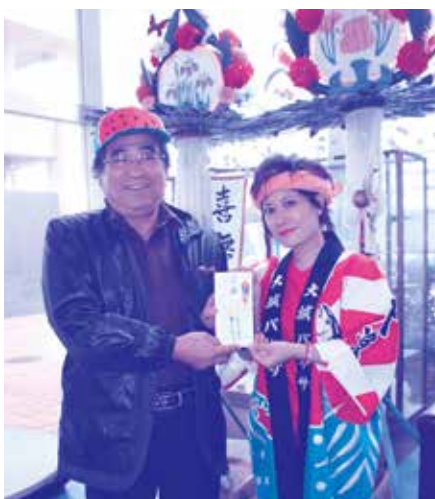
▲ 喜屋武村長へ代理で 寄附を渡すバナサさん