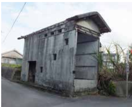
▶謝名の乾燥小屋跡