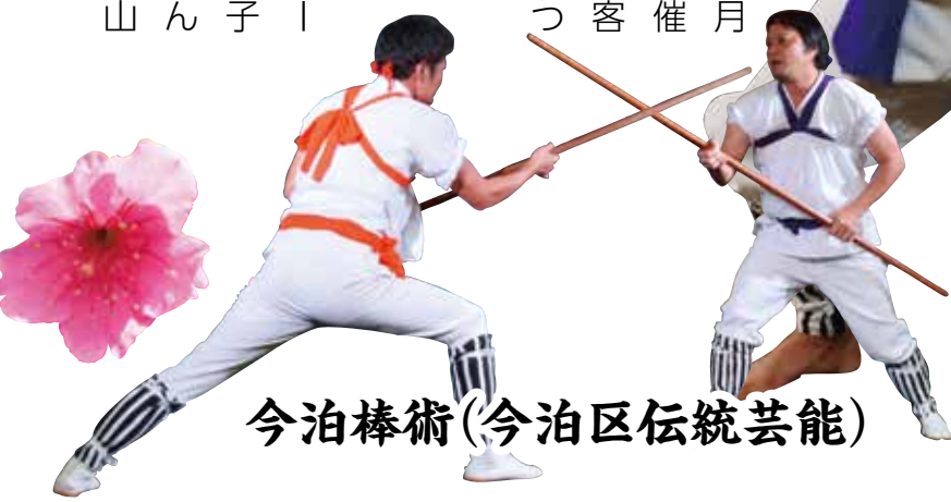
今泊棒術(今泊区伝統芸能)

第11回今帰仁グスク桜まつり、1月27日から2月12日までの17日間の開催で村内外及び国外からも多くの観光客が訪れ5万人を超える来場者が桜まつりを楽しみました。 祭り期間中は、世界遺産今帰仁城跡が幻想的に彩られ、沖縄を代表するラジオ番組ゴールデンアワーの特別番組の開催、伝統芸能の披露、子どもたちによる芸能まつり、『たまんちゅ。』（湧川出身）による大道芸、北山