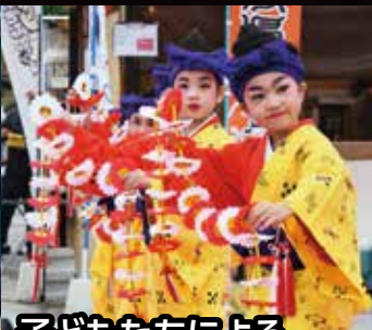
子どもたちによる 芸能まつり