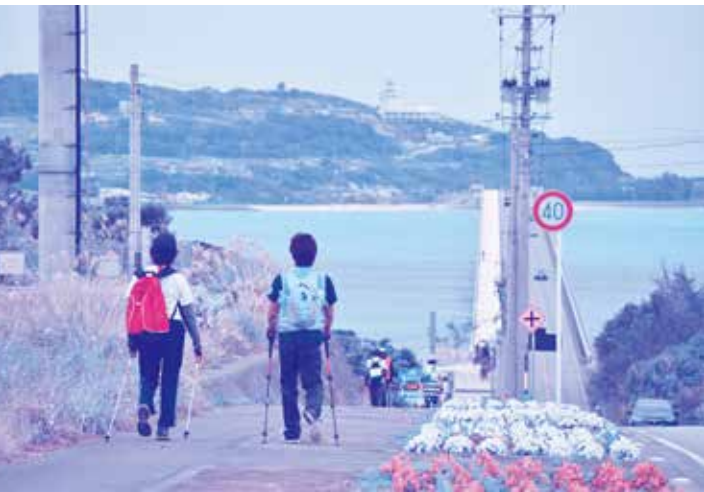
▲ 古宇利大橋コース

今帰仁村運動公園をスタートに、りかりかワルミコース(7km)、古宇利大橋コース(12km)と分かれ二番桜ノルディックウォーキングが開催されました。総勢100名余りの方が参加し、遠くは北海道からお越しの方もいました。参加者は、新春の風吹く今帰仁村の風景を楽しみながら、それぞれのペースで爽やかな汗を流していました。ノルディックウォーキングは、ポールを使用して歩くスポーツです。腕を使うことで運動効果が高まり、ひざや関節への負担を和らげるので、年齢を問わず誰でも簡単に楽しむことができます。