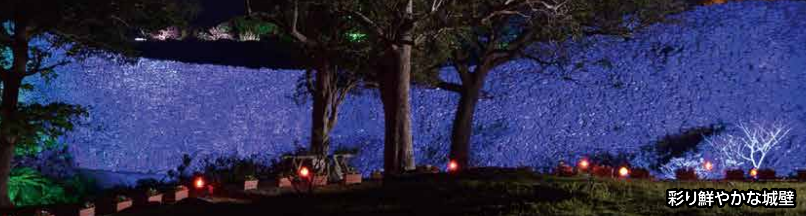
彩り鮮やかな城壁