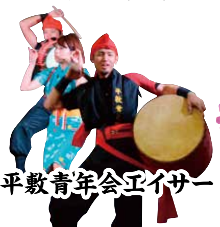
平敷青年会エイサー