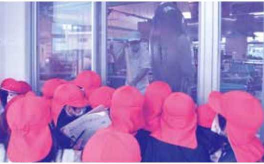
▶ 調理員による 器具の説明中

今帰仁小学校1年生の児童達が給食センターを訪れ、給食ができるまでの見学を行いました。