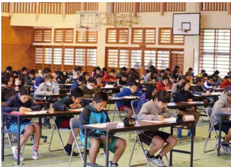
▲真剣な表情で頑張っていました

実施科目は、国語・算数・理科の3教科。中学校の広い体育館の中、子ども達の一生懸命にテストに向かう姿が見られ、答えを書き込む鉛筆の音だけが響いていました。