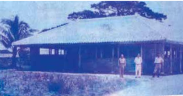
昭和22年 楠(クスノキ)で建てられた今帰仁村役場