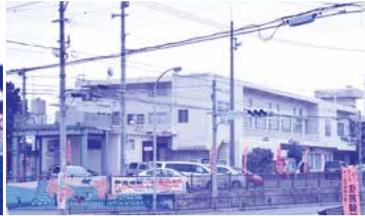
現在の今帰仁村役場(築55年)