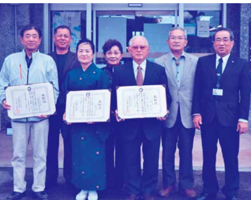
▲ 表彰者と関係者の皆さん