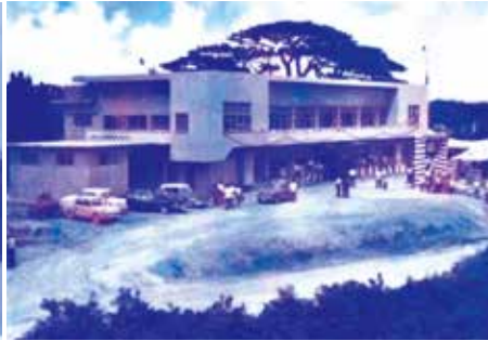
今帰仁村役場【昭和37年竣工写真】