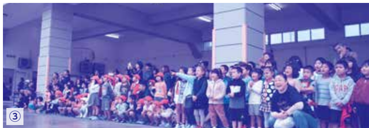
①服装点検中 ②仲宗根保育所の演技、最後に大きな声で、「火のよ〜じん!マッチいっぽん火事のもとー!」 ③訓練の様子に釘づけでした ④屋上からの降下訓練