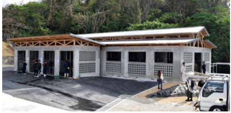
新しい待機小屋 闘牛大会の様子

今帰仁村営闘牛場、待機小屋落成を兼ねた北部闘牛組合主催の新春北部大闘牛大会が開催されました。 会場は、村内外から多くの人が駆けつけ白熱する戦いを見て歓声に包まれていました。 待機小屋は、これまで、老朽化で屋根も無い状態でしたが、新しく建て替えを行い、待機場所もこれまでの16頭から20頭が待機できるようになり、より大きな大会が開催できるようになりました。 その他、待機小屋の周辺の舗装、闘牛場ステージの新築、闘牛場内及び観客席の改修が完了しており、3月にはトイレの新築工事も完了します。村の観光資源として活用が期待されます。