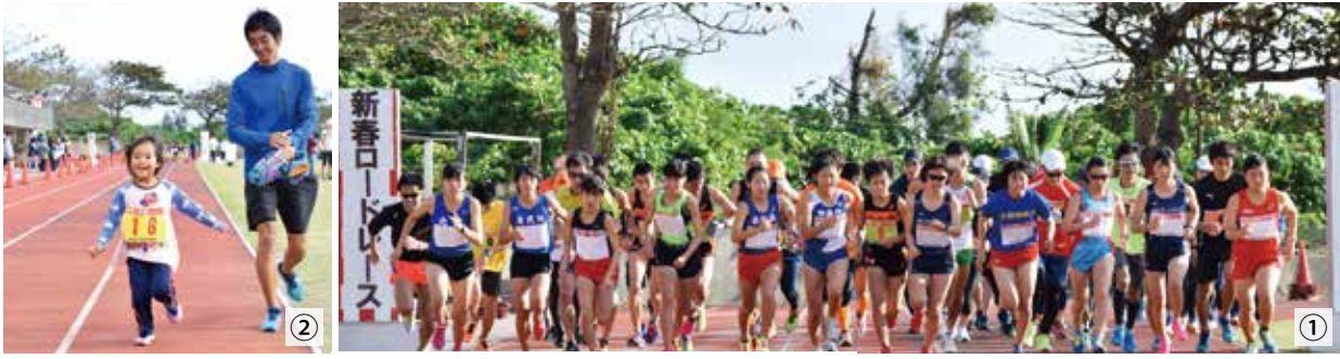
①新春初走り②最年少4歳も頑張っていました③歩け歩け体育館前からスタート④景色を楽しみながら自分のペースで初歩き