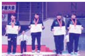
▲全日本学表彰 2位(左端)