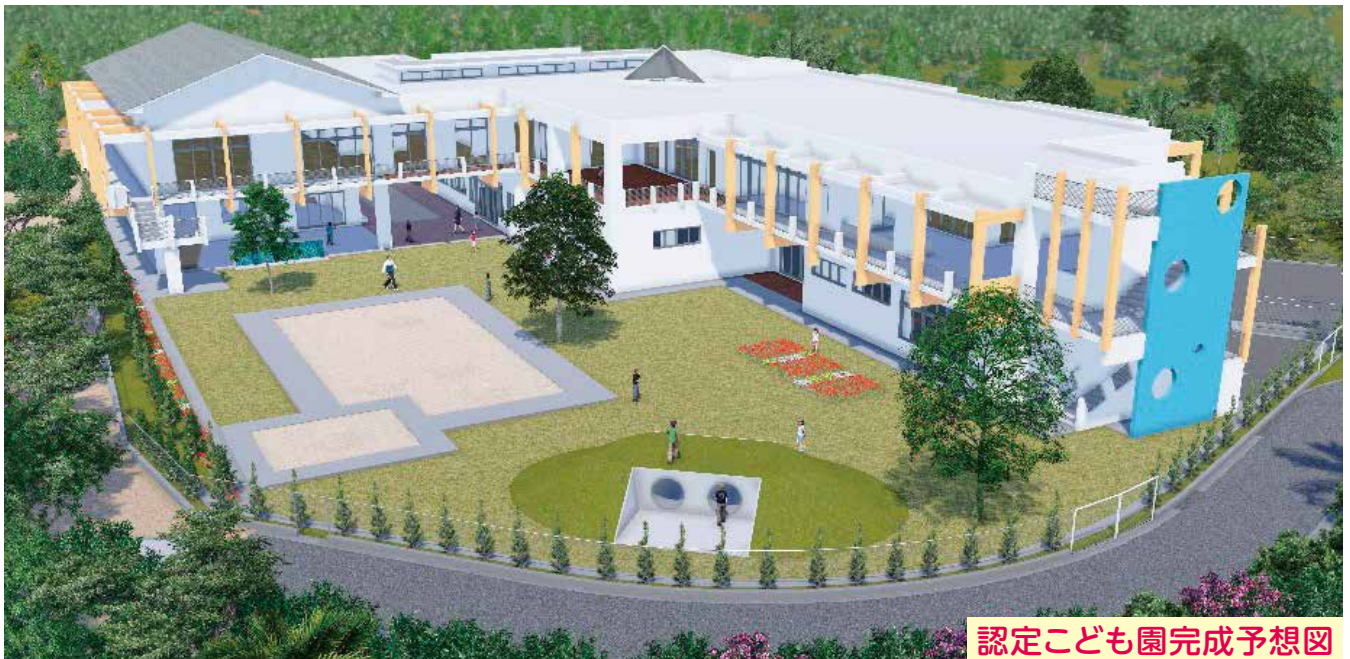
認定こども園完成予想図

園児の安全、安心な教育・保育を確保するために、平成31年4月開園を予定していた「認定こども園」(*幼稚園と保育園の機能を兼ね備えた施設)の開園を1年先に延ばし、平成32年4月に開園する事となりました。詳細については、今帰仁村教育委員会ホームページ及び、「認定こども園、保育所民営化だより」=第6号=(H29.10.1発行)をご覧ください。なお、認定こども園の開園延期に伴い、平成31年3月末で閉園を予定していました「中央保育所」「仲宗根保育所」「今帰仁幼稚園」の3園については閉園を1年延長して園児を受け入れることとなりました。どうぞ皆様のご理解をお願いいたします。