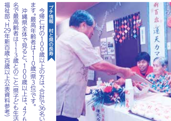
▶子情報 村と島の長寿

今帰仁村の100歳以上の方は、合計で36名います。最高年齢者は110歳(県3位)です。