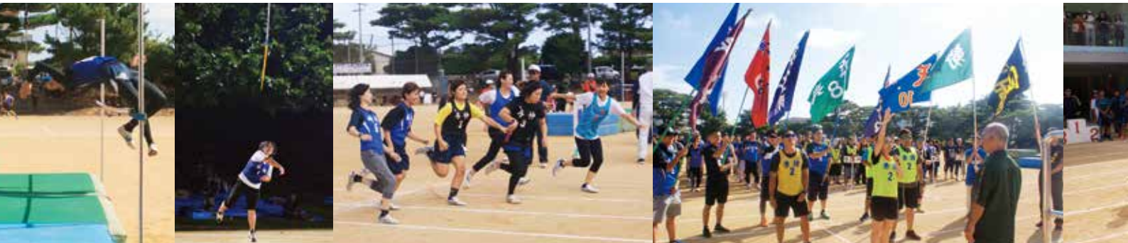
トラックの部(男子) ■ 一般男子 ■ 30代男子 ■ 40代男子 ■ 50代男子 ■ 60代男子