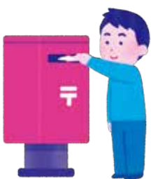
▶各小学校へ配布されました