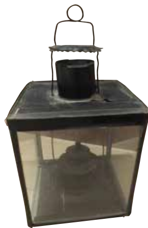
▲主に外出時に用いたカクランプ

ガラス部分はホヤと呼ばれ、煤(すす)が付いては部屋が暗くなるため手入れが必要となる。その際に、小さなホヤ部分に手を入れることのできる子どもが、ホヤ磨き仕事を任されていた。 ホヤは薄く、過って割ってしまい、叱られてしまうこともあったようだ。 ローソク三本ほどの小さな灯りの下では、父は道具の手入れをし、母は縫い物、子は宿題と、一家団欒を柔らかな灯りが包み込んでいたのでしょう。(玉城菜美路)