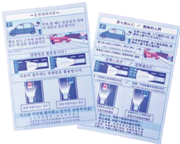
▶ 外国語表記のチラシ 英語、中国語、韓国語

6月30日には、本部警察署、本村地区交通安全協会、村商工会、村商工観光協会、村役場の関係者が古宇利橋詰広場に集まり、レンタカーを対象に事故防止に向けたチラシの配布活動を行っています。