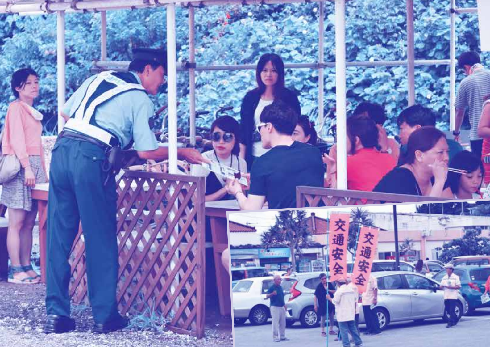
▲「アーユコリアン?チャイニーズ?」と声かけを行い チラシの配布を行っています