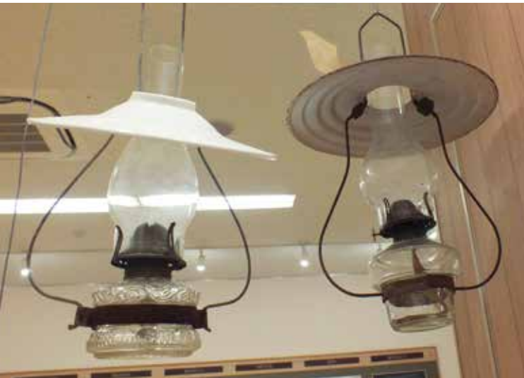
▲室内に吊るして使用したホヤランプ

上江洲均著『沖縄の民具』のホヤランプの説 明に「いかにも垢ぬけのした洋風の感じのランプである」とある。なんと味のある解説だろうか……。