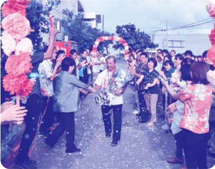
▶多くの職員に見送られました