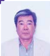
与那嶺区長 島袋 隆則