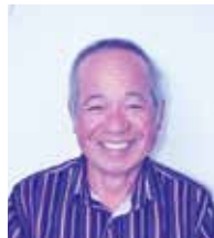
諸志区長 内間 繁樹