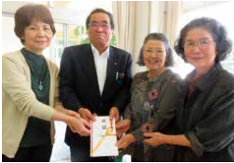
◀ 商工会女性部のみなさん

村商工会からは、未来を担う子ども達の支援に使って欲しいとのこと。どちらも将来の今帰仁村を支える子ども達のためへの寄付。ありがとうございます。