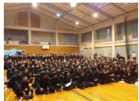
▲ 中・高合同のスーパー講師による講演会

このように沢山の事業を取り組みながら地域貢献・社会貢献できる人材の育成を行っています。