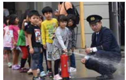
消火器の取扱い体験の様子