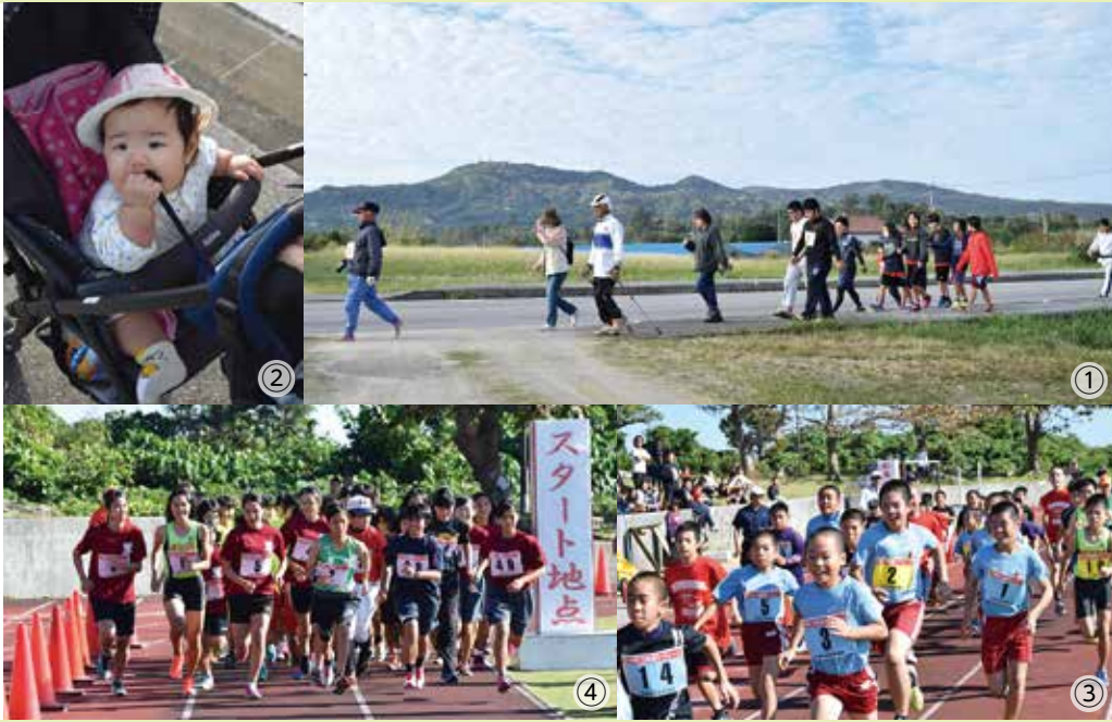
①乙羽山をバックにウォーキング②ベビーカーで赤ちゃんも参加③男の子笑顔でダッシュあと2キロあるよー④女の子は落ち着いてるねー