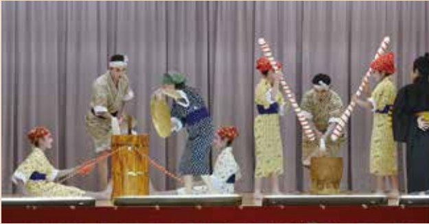
▼稲しり節 若い世代も頑張ってます。