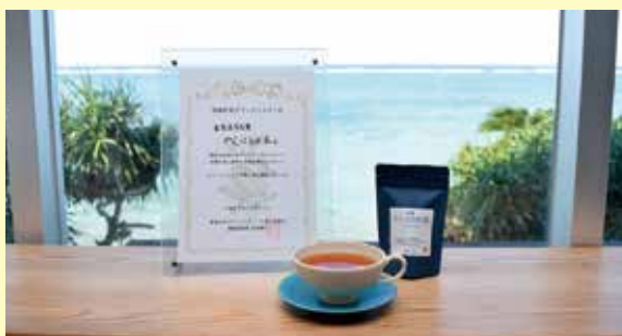
▶綺麗な海とおいしい紅茶で癒されました。