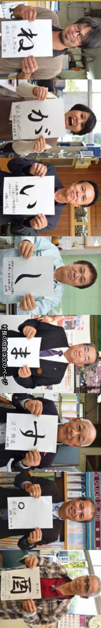
村長の抱負がのページ