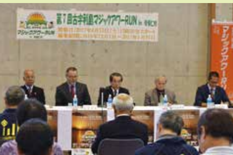
▲申込締め切りは1月31日までとなっています

他のマラソンと異なり土曜日開催であり、 HALFマラソンですが制限時間が3時間30分と長めに設定されています。また、託児所コーナーも設置され女性ランナーの数が4割を占める女性に優しいマラソン大会となっています。今年こそは参加してみたいかがでしょうか。