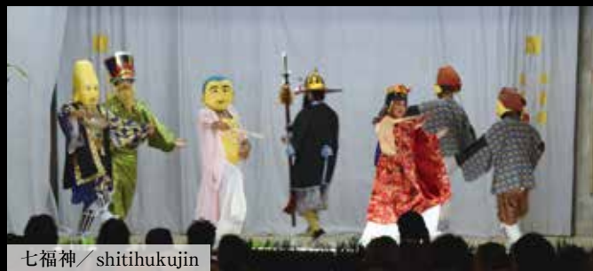
七福神 / shitihukujin