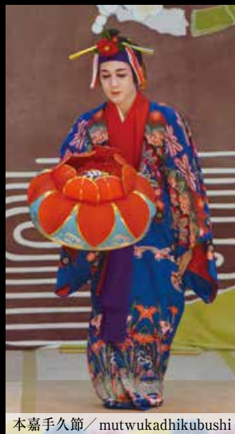
本嘉手久節 / mutwukadhikubushi