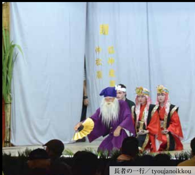
長者の一行 / tyoujanoikkou

9 / 15 上運天区、9 / 17 湧川・与那嶺区で豊年祭 が開催されました。 与那嶺区は4年ぶりの開催。各字では、その地に 古くから引き継がれてきたウドウイ(踊り)を披露 しアサギに来訪した神様に五穀豊穡、無病息災、子 孫繁栄を祈願します。 夜空に輝く月の下、三線や太鼓の音が響いた後に 指笛と拍手が鳴り続いていました。