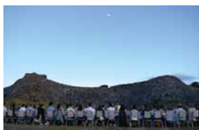
▲月明りと今帰仁城跡をバックに食事