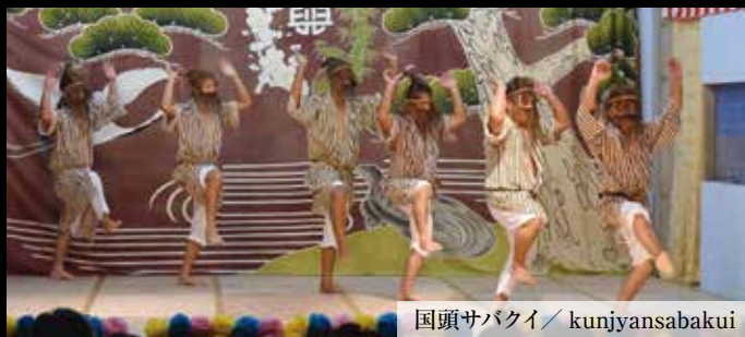
国頭サバクイ / kunjyansabakui