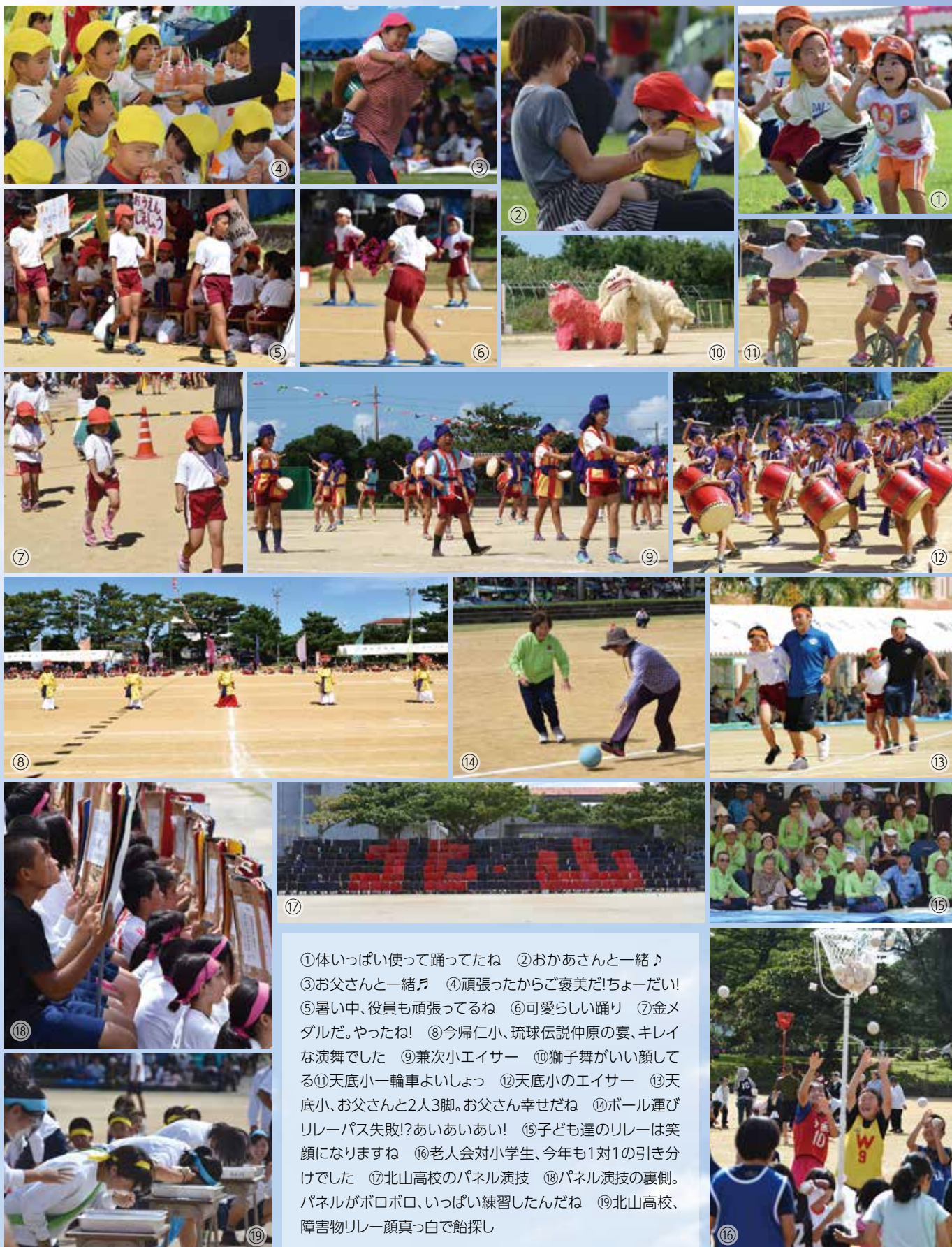
①体いっぱい使って踊ってたね ②おかあさんと一緒♪ ③お父さんと一緒♪ ④頑張ったからご褒美だ!ちょーだい! ⑤暑い中、役員も頑張ってるね ⑥可愛い踊り ⑦金メダルだ。やったね! ⑧今帰仁小、琉球伝説仲原の宴、キレイな演舞でした ⑨兼次小エイサー ⑩獅子舞がいい顔してる ⑪天底小一輪車よいしょっ ⑫天底小のエイサー ⑬天底小、お父さんと2人3脚。お父さん幸せだね ⑭ボール運びリレーパス失敗!あいあいあい! ⑮子ども達のリレーは笑顔になりますね ⑯老人会対小学生、今年も1対1の引き分けでした ⑰北山高校のパネル演技 ⑱パネル演技の裏側。パネルがボロボロ、いっぱい練習したんだね ⑲北山高校、障害物リレー顔真っ白で鉛探し

9/24 北山祭、9/25 各小学校運動会、10/8 村立保育所合同運動会、10/9 老人婦人スポーツ大会