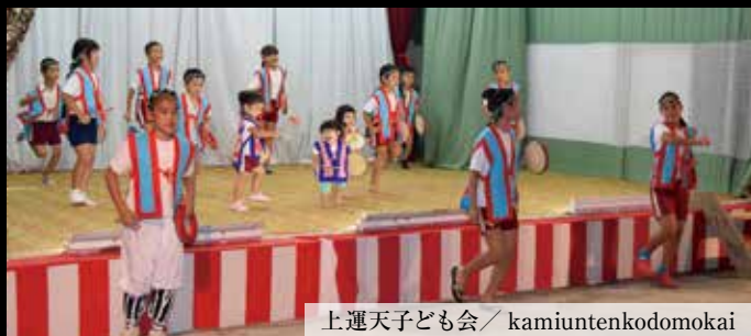
上運天子ども会 / kamiuntenkodomokai