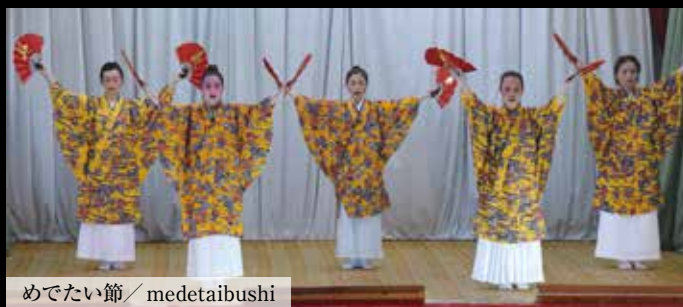
めでたい節 / medetaibushi