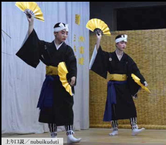
上り口説 / nubuikuduti