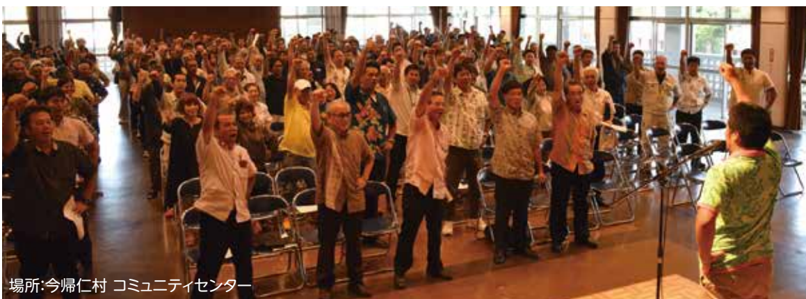
場所:今帰仁村 コミュニティセンター