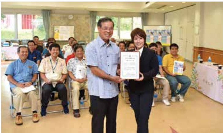
▲今帰仁村のPRよろしくお祈いします!