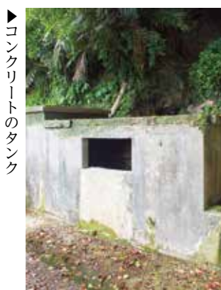
▶コンクリートのタンク