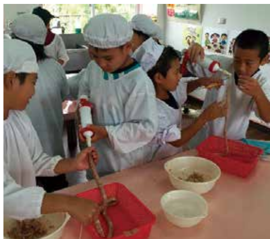
天底小のソーセージ作り

今回の1泊2日での内容は、「味噌作り」この取組みは後日、家庭科の授業で味噌汁作りをする為の前準備です。大豆をすり潰し、発行して味噌になるまで数ヶ月の我慢です。美味しい味噌になるのが楽しみです。