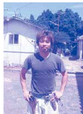
受給3年目 マンゴー、ゴーヤー等栽培