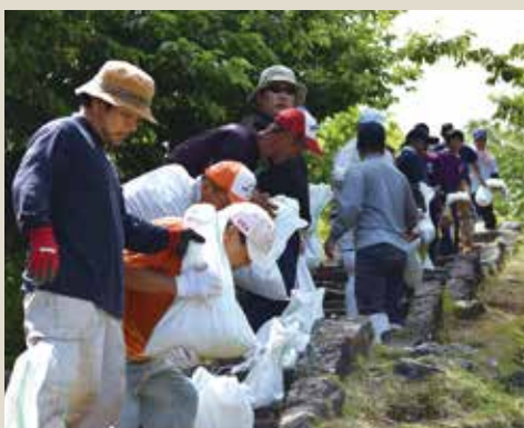
▲みんなで列になり砂利運び