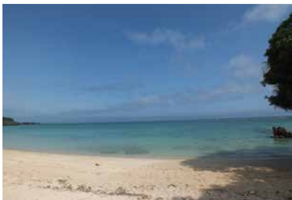
▶長浜の海場所：与那嶺1318-11近く

た。岩のくぼみには、手いっぱい何百とすくえる玉粒みたいな美しいやどかりが群棲していた。桶を頭に乗せて、潮汲みに通った女の姿も、山原船の帆影とともに、もう遠くへ消え去ってしまった。わずか五六十年の間に、今帰仁の海は著しく浅くなった。入江が干潟になり、干潟から潮が後方へ引くにつれて、村人たちは次第に海から遠ざかり、ついに海を忘れてしまった。」(今帰仁村史「海路をたどる」仲宗根政善)