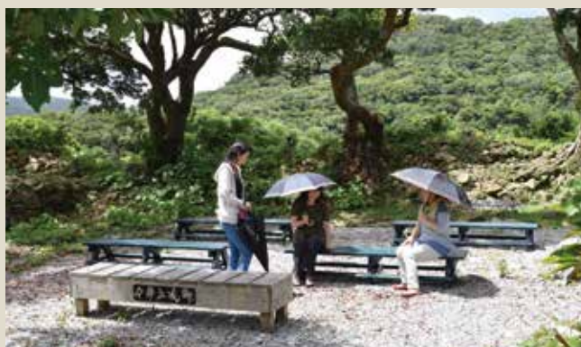
▲一息いかがですか？