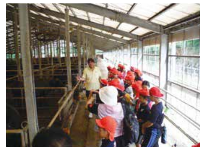
▲ 牛舎を見学する兼次小学校5年生