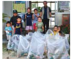
▲ いっぱい拾いました