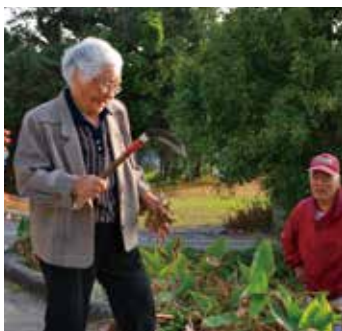
▲ 病院に行く途中なのに草刈りしようとしてました!!元気ですね。