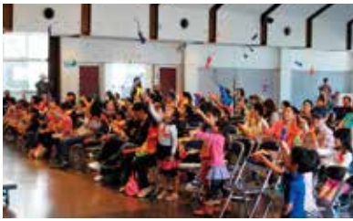
▲自分で作ったバルーンネズミ しっぽを引っ張ると飛び上がる!!

※コミセン2階ホールにて第4回ピカピカの新1年生 励会が開催されました。 参加した新1年生は、みんな で「ドキドキドン！いちねんせい」 を歌った後、社協スタッフに よる腹話術で楽しく交通ルール を学び、仲尾次区子ども会によ る余興やクラウン・コトラさん によるバルーンパフォーマンス を楽しみました。