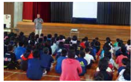
▲ 教育長講話 (天底小)