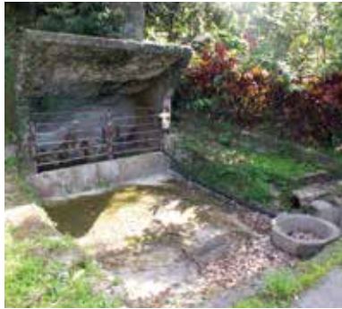
▲ 勢理客公民館近くにあります

勢理客公民館の下に、「マーガヌハー(孫の井戸)と呼ばれる湧泉の井戸が残っています。コンクリートの覆いの右側に「一九五八年拾月貳拾五日竣工 孫の井戸」の文字が見えることから、昭和33年以降も地域の水汲み場所として使われていたことが分かります。なぜ孫の井戸なのか？以前聞き取りしたところ、理由ははっきりしないけれど、昔は井戸の向かいに池があり、孫が熱を出したとき、その池からオバアたちがタイユ(フナ)を捕って、この井戸の水でタイユシンジ(煎じ汁)を作り、熱冷ましに飲ませたからでは？との話を伺いました。勢理客の皆さま、ぜひ真相を究明して下さい！井戸の側にはコンクリート製のイモ洗い場がきれいに残っていますよ。