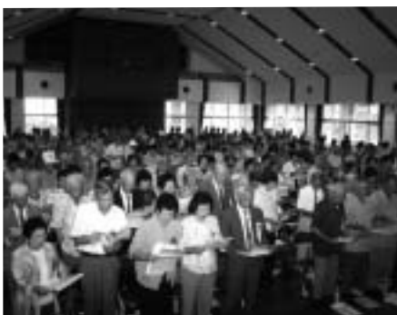
▶ 会場を埋めつくし、盛大に大会が行われた。