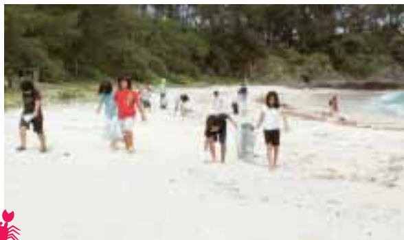
砂浜のゴミを拾う子ども会のメンバー

清掃作業終了後は、バーベキューで肉厚の牛肉や焼きそばをほおばり、参加者らは潮風を受けながら舌鼓を打った。