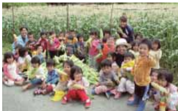
トウモロコシ畑を背に記念撮影

収穫したトウモロコシの一部はその場で試食され、園児らは「甘〜い〜」と大喜び。農産物のありがたさを肌で感じた一日になった。