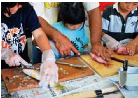
▲魚さばきの勉強中