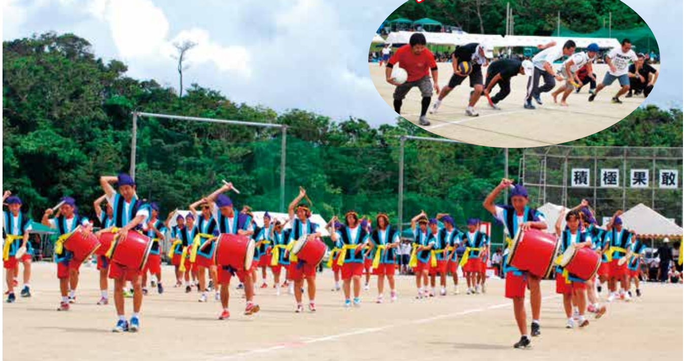
▲ 3年生全員によるエイサー