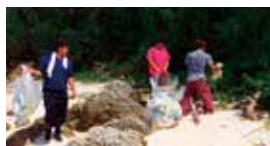
▲清掃を行う仲宗根青年会

仲宗根青年会は、エイサー活動だけでなく、空き缶やビン、古紙の回収などリサイクル活動も行っており、リサイクルで得たお金は公民館への設備投資として活用していく予定。