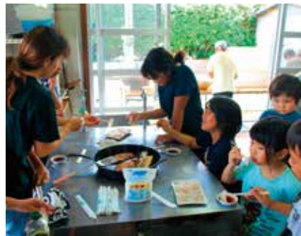
▲自分でさばいて食べました