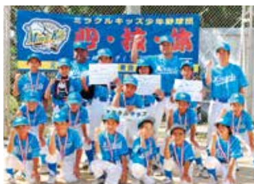
▲準優勝 ミラクルキッズ