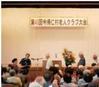
▲多くの方が表彰されました

老人クラブは65歳以上の会員が大半を占め今後の目標として60歳から65歳の加入促進を目指すという。高齢化社会となるなか、活発的な60歳以上が増えてきている。若い世代の目標となれるような元気で素敵な高齢者として活躍が期待される。