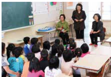
▲ 交通安全守ってね。