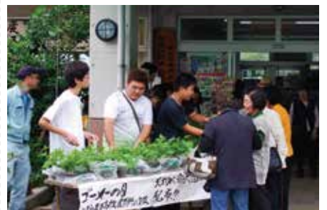
▲ 生徒達から苗のプレゼント