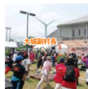
▲ 走る前には、みんなで ストレッチ!!