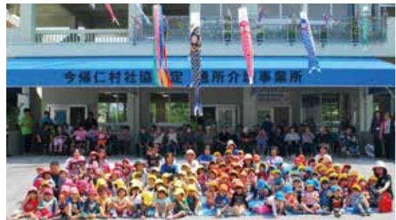
◀ みんなで掲げたこいのぼりの下でハイチーズ

掲揚式では、参加者全員でこいのぼりやチューリップの歌をうたい、子ども達によるゆうぎが披露され、子ども達には、社協利用者よりお菓子がプレゼントされた。