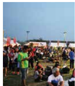
▲ 会場いっぱい人が 集まりました