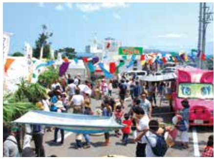
▲ 食でにぎわうリカワワルミ

4月20日、橋の駅リカワ ルミにて、フードフェス・香祭 (かばーさい)が開催された。村 内外の畑人20名と飲食店・宿泊 施設26店舗が連携し「やんばる は美味しい」を全国へ発信する 『食』を中心としたプロジェクト のイベントで、今回はワルミ 大橋の「絶景」と10店舗のブー スを設置しやんばる地域全体 の食の豊かさや楽しさを伝え た。 リカワワルミでは、地元 の食材が販売され、店舗では 地元食材を利用した食べ物の 提供をするなど、祭り会場は 食を求める人達でにぎわった。