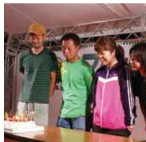
▲ 当日誕生日の方へ サプライズパースデー