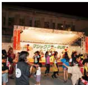
▲ 最後はみんなで カチャーシー