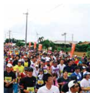
▲ すごい人の数!! みんな頑張って下さい!