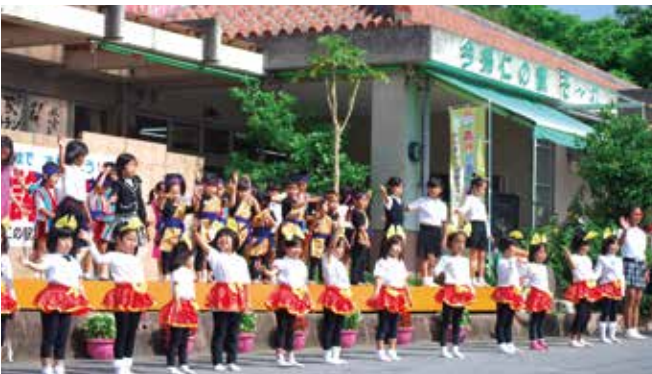
▲ 北山学堂の子ども達による手作りの式。