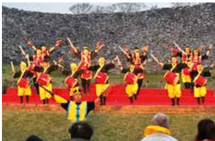
▲祝宴の舞・今帰仁子供太鼓 いまじん