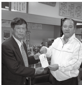
▲(左)安谷屋会長と新里校長(今中)