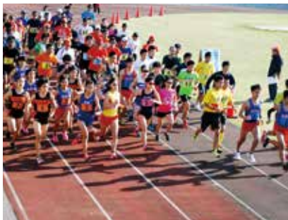
▲一般、30代、40代50代の部がスタート