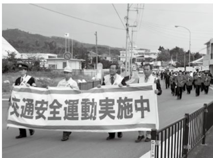
▲パレードで交通安全を呼びかけた