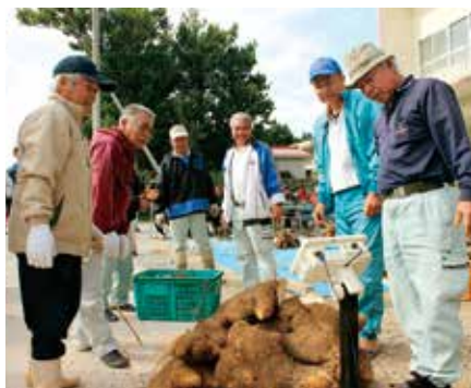
◀ 検量する山芋会のメンバー