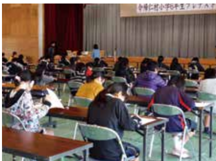
▲真剣な眼差しで取り組む児童たち

1月7日(火)に小学校の基礎学力の定着と到達度の調査を目的に、今帰仁村学力向上推進委員会・村教育委員会主催によるプレ中学入試が村内の小学6年生を対象に実施された。今帰仁中学校体育館で国語・算数・理科・社会の4科目に取り組んだ。