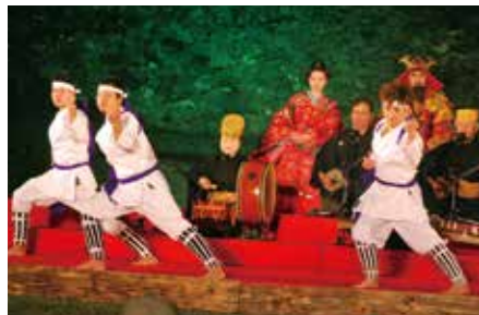
▲亀ぬ甲(仲尾次区伝統芸能)