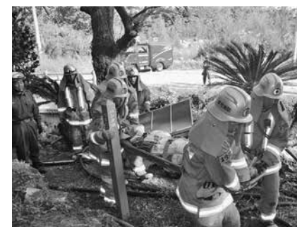
▲ハンタ道を登る消防署員

本部町・今帰仁村消防組合は、10月30日(水)に今泊区内で山林火災を想定した合同遠距離送水訓練が実施され、総勢20名が参加して行われた。エーガーからくみ上げられた水はポンプ車で送水され、急こう配のハンタ道をホース約40本、700メートル余りの距離を隊員たちが可搬動力ポンプやホースなどを搬送、設置し放水。鎮火制圧を確認し訓練を終えた。防火衣を着用した隊員の装備は7~8kg。体力錬成を兼ねた訓練を終えた隊員からはいつもの明るい笑顔は消えていた。