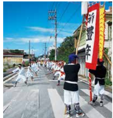
◀スーパーずけやま前で棒術披露

豊年祭の2日間、今回初めて完成した東屋を舞台に秋を感じさせる涼しげな風が吹く中、24の演目が披露された。