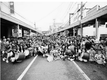
▲エイサー隊全員集合

※今回寄付金を募ってくれた今帰仁村の方々には大変お世話になりました。感謝申し上げます。(関係者一同)