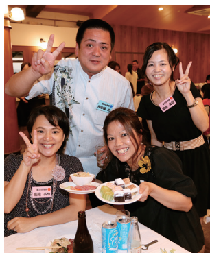
▲ごちそうもいっぱい