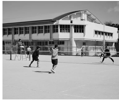
▲今帰仁中のテニスコートで