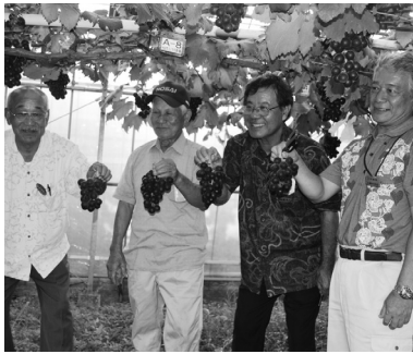
▲たわわに実りました

ことで、村の農業発展に寄与していきたい。」と述べ、嶺村長は「生産技術の改良により新たなぶどうとして奨励する作物として考えていきたい。」と語った。