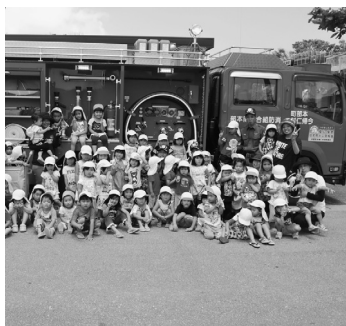
▲ポンプ車の前でハイチーズ

を実施してこの日、ポンプ車、タンク車、救急車の三台の見学会も行われ、園児たちはめつたに見ることができない運転席や、救急車の内部まで興味深そうに見入っていた。