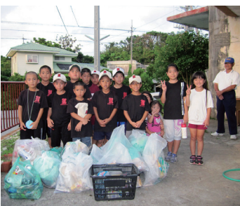
▲いっぱい集めたぞ〜と玉城区の子ども達