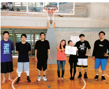
▲優勝したBar Rio チーム

2月3日(日)に村民体育館で村体協(嘉陽宗敬会長)主催による村バスケットボールフェスティバルが村民体育館で開催され5チームが参加。優勝はBar Rio、準優勝は歌麿でした。