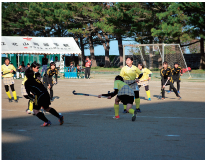
▲北山高校女子 対武岡台高校戦