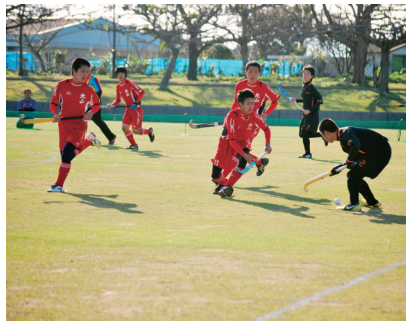
▲北山高校男子 対玄海高校戦

男子決勝戦は熊本県代表小国高等学校が長崎県代表川棚高等学校に延長戦の末、三対二で勝利。女子決勝戦は佐賀県代表伊万里高等学校が熊本県代表小国高等学校を六対〇