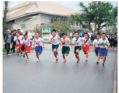
▲勢いよくスタート