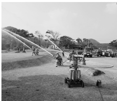
▲放水を見守る関係者

1月25日(金)に今帰仁城跡平郎門前広場で文化財防火デーを前に、関係者・消防員ら20名余りを集め火災避難訓練が実施された。午前10時10分に城跡内での火災を発見、関係機関への通報、初期消火、本・今消防署による消火デモンストレーションが行われた。