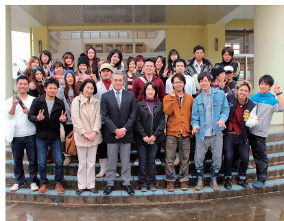
▲今帰仁小学校121期生