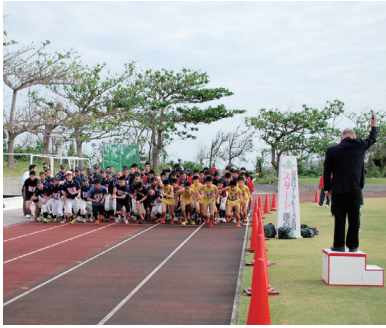
▲中学生男子がスタート

また、同会場では第九回村民新春歩け歩け大会(主催:村健康づくり推進協議会)が開催され、乙羽岳山頂を折り返す約十五kmのコースに三十五名が参加した。山頂では温かいぜんざいも振舞われ、それぞれの体力に合わせ完歩を目指した。