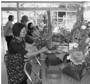
(手前)生花を指導する仲宗根区長

参加者からは「自分の生花で新年を迎えられ毎年清々しい。」と好評だ。仲宗根区長は「公民館を活用して、ユンタクしながらの講習は皆楽しそうだ。続けていきたい。」と笑顔で語ってくれた。