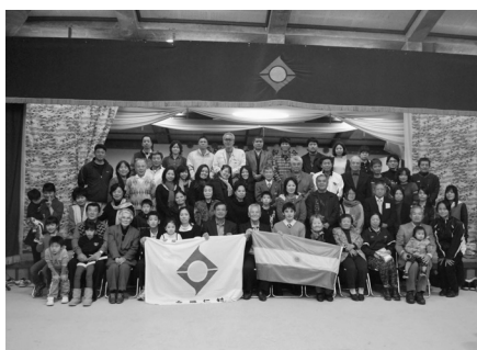
▲親族・関係者一同“ハイチーズ”