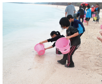
▲タマン稚魚の放流