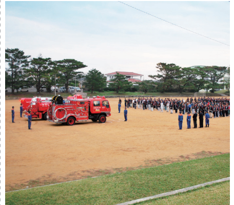
▲早朝にもかかわらず大勢の消防団員が終結

11月9日(金)に村営グラウンドで平成24年度秋の全国火災予防運動に今帰仁分遣所13名、村消防団員313名が集まった。本・今消防組合管理者の與那嶺幸人村長は「災害は一瞬にして尊い生命や財産を奪う悲惨なものであります。消防職員並びに消防団員の皆様には、責務の重要性を再認識し、住民の安心・安全確保のために更なる努力を願いたい。」と訓示を述べた。