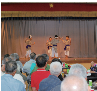
▲子ども達が盛り上げます。

宗家眞境名本流眞薫結の会による「かぎやで風」で幕開け、北山高校生女子七名による「稲しり節」など盛りだくさんの演目で楽しいひと時を過ごした。