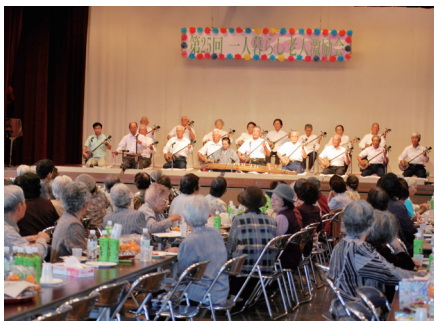
▲おじい・おばあは宝です。

上間会長は「外に出て、ユンタクすることは健康で大切なこと。」とあいさつし、会場に足を運んだ参加者の労をねぎらった。