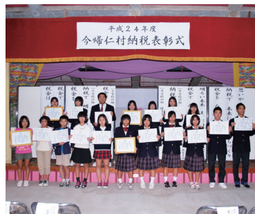
▲小中高生の皆さん