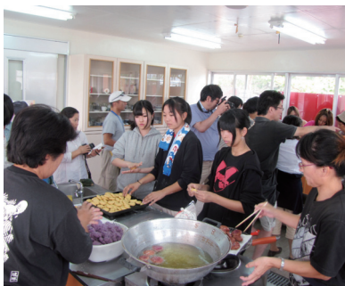
▲慣れない手つきの生徒の皆さん