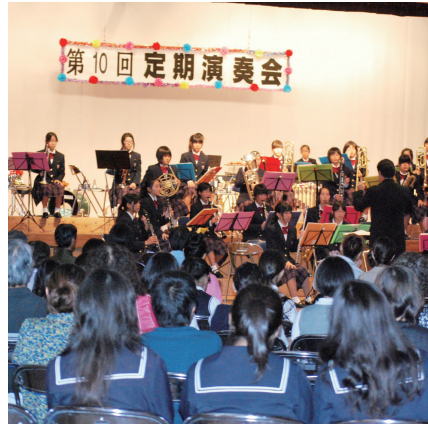
▲力強い演奏で観客を魅了

11月4日(日)に村コミュニティセンターで第10回定期演奏会が行われ、卒業生や保護者、関係者200名余りが詰めかけた。3年生にとっては中学最後の演奏会。7年ぶりに出場した県マーチングフェスティバルでは銀賞を受賞するなど、地区・県大会での目覚ましい活躍の締めくくりとあって、クラシックにポップス、中学OB吹奏楽団との合同演奏など多彩なプログラムで観客を楽しませた。