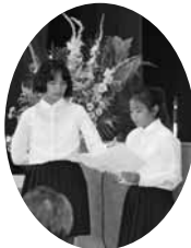
▲元気よく激励のあいさつをしてくれた古宇利小の皆さん