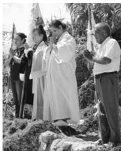
▲祈りを捧げる神人の 皆さん

お昼ごろから白装束にを身 にまとったカミンチュ(神人) が島の南側にある神アサギで 御願を終え、シラサ岩での「神 送りの儀」が執り行われた。今 年は御祈りを捧げるカミンチュ も一人増え、島んちゅは貴重