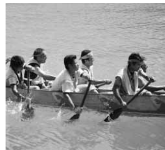
▲御願パリーも盛り上がりました。