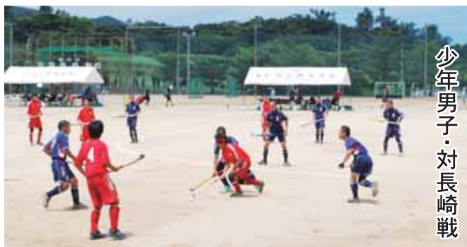
少年男子・対長崎戦