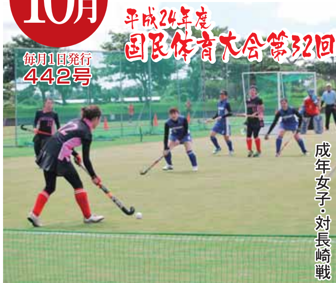
成年女子・対長崎戦