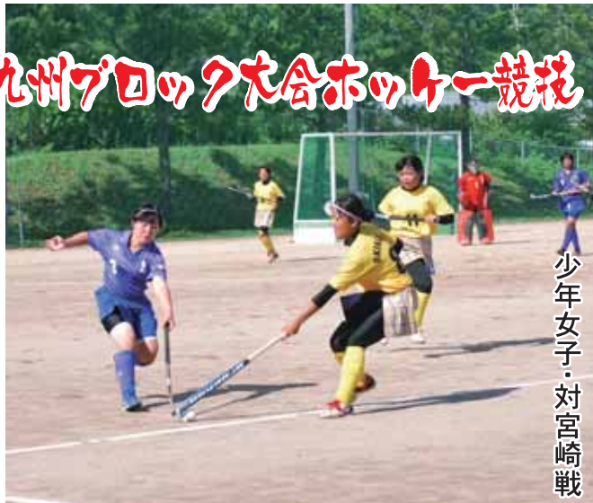
少年女子・対宮崎戦