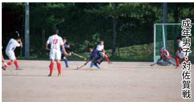
成年男子・対佐賀戦