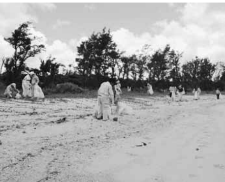
◀憩いの浜の姿を取り戻しました。

七月二十七日(金)に北部農林水産振興センター農業水産整備課が主催して「渚のクリーンアップ作戦」が展開され、村内からは建設業協会を中心に区民が集まり、村外からのボランティアを含め八十人余りが参加して今泊農村公園の北側のクビリ浜と、シバンティナの浜を二手に分かれ清掃を行った。