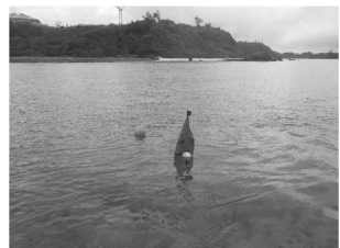
海洋保護区を示すブイ