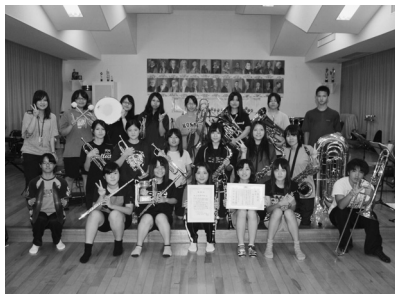
▲練習にも力が入る

7月31日(火)に第57回九州吹奏楽コンクール沖縄支部予選で銀賞を受賞し、8月7日(火)に浦添市てだこ大ホールにて第8回南九州地区吹奏楽コンテスト(主催:沖縄・宮崎・熊本・鹿児島、各県吹奏楽連盟)に出場することが決まった。文化部で県を代表してコンクールなどに出場するのは久しぶりとあって、部員は上位入賞を目指し毎日3~4時間の練習を積み重ねている。