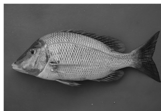
ハマフエフキ(タマン)

今帰仁海域はハマフエフキの好漁場でしたが、資源の減少が顕著となったため、資源の回復に向け平成12年から水産資源保護を目的とした海洋保護区(MPA)を設定し、今年で13年目の取り組みとなります。