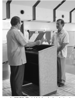
▲当選証書が付与されました。