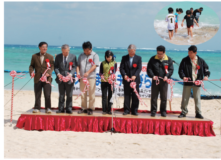
北風に負けずマリンレジャー開幕

ない悪天候。参加者は海に浸かるも潜れない中、子供達は引き潮を待つてサザエを探していた。