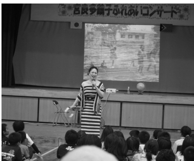
▲自然と手拍子が会場から沸き起こる。

クトーを使いながら現状を伝え、昨年3月に起こった東日本大震災後、7月に訪れた被災地でのコンサートの様子などを語った。