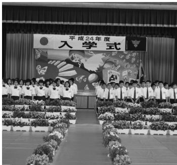
真新しい制服に身も引き締まる