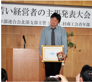
若い経営者の主張発表大会