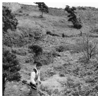
▲広い大隅に草刈機持参で作業

12月25日(日)に今泊区消防団活動の一環として城跡内の大隅を約20名で草刈り作業を行った。この日は天候にも恵まれ今帰仁グスク桜まつりの準備にご協力いただきました。