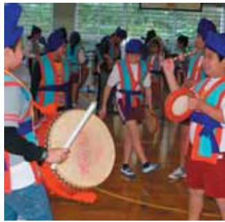
Sジンを披露してもらいました。エイサーを酒田市でも広めてね