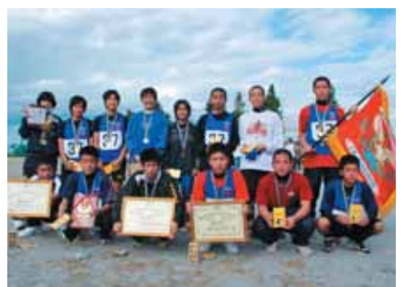
実力発揮!! 仲宗根区の選手たち