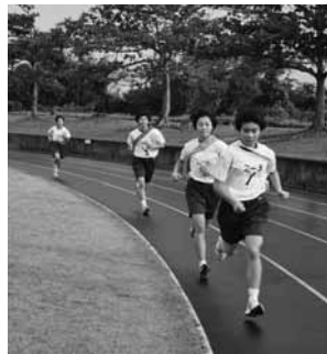
▲1区エース区間の激しい競り合い

あいにくの小雨模様の天候にも拘わらず、多くの保護者が大会の運営と応援に駆け付け、生徒達の力走を見守った。トップが激しく入れ替わる中で、二年三組が優勝した。