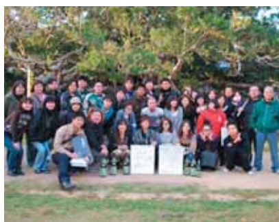
集まったみんなで記念撮影