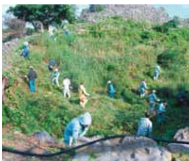
いつもご協力ありがとうございます。

十二月二十一日(水)に第5回今帰仁グスク桜まつりの準備作業に村建設業協会から二十名余りが今帰仁城跡のカーザフで草刈り清掃を行った。十二月らしからぬ晴天に恵まれ、背丈まで伸びた草木に悪戦苦闘しながらも、きれいに片づいた。お疲れさまでした。