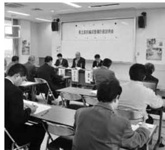
▲村関係者、保護者らが集まった。

公立大学に対応する特化した科目で理数科に代わる学科の設置は?」等の質問や意見交換が交わされた。