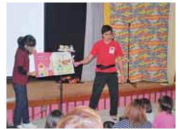
▲ALTのトキ先生も参加