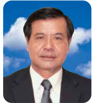
市長 與那嶺 幸人