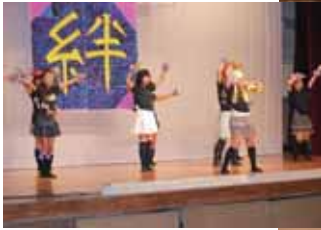
▲平敷区 ヘビーローテーション