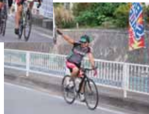
交流もたのしみのひとつ