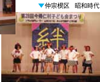
▼仲宗根区 昭和時代