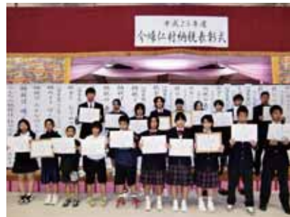
▲表彰を受けた生徒のみなさん

平成23年度「税の作文・標語コンクール」には242人の応募があり、標語の部、作文の部の計4部門で優秀賞・優良賞が授与された。