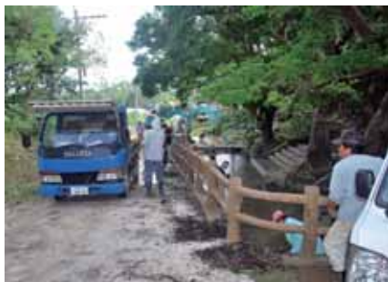
▲重機2台で大活躍、きれいになりました

11月13日(日)に今泊消防団約20名がエーガーを大清掃。この日、字消防団の役員改正もあり清掃活動を行うことになった。子供たちに字の財産を守り引き継ぐために、お父さんたちはひと汗流しました。