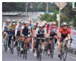
女子とはいえものすごいスピード

ツール・ド・おきなわ二〇一(主催：NPO法人ツール・ド・おきなわ協会・北部広域市町村圏事務組合など)が十一月十二日(土)・十三日(日)にやんばるを舞台に開催された。男子チャンピオンレースをはじめ市民レース部門、サイクリング部門、名護市街地での一輪車レース、各種イベントなどに四千四百名余りの参加者が集結。本村では午前七時過ぎ男子チャンピオンレースの集団が通過。中学生、市民レースの選手が次々と通過していく中、沿道から声援を送る村民に手を振る光景も見られた。