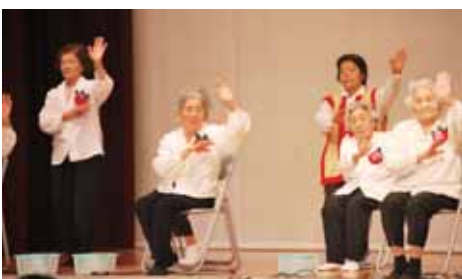
▲ちゃあがんじゅう おばあ達