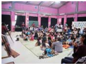
▲子供達のおたのしみ