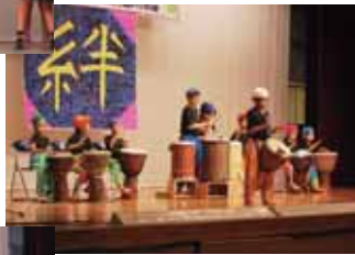
▲仲尾次区 アフリカ太鼓