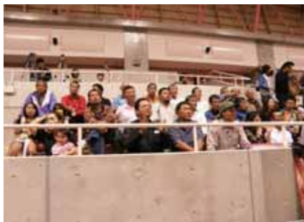
▲応援にも熱が入ります