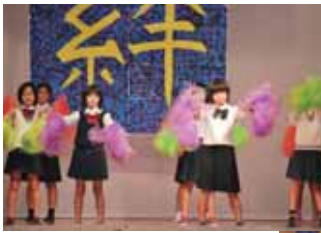
▲今泊区 フライングゲット

十一月二十六日(土)に村コミュニティセンターにて第二十八回今帰仁村子ども会まつりが開催された。村内外から子供たちの祭典を見ようと観客が詰めかけ会場は満席状態。 子ども会への寄贈報告の後、ジュニアリーダーたちを中心に運営され、十六のプログラムの中には二つの字が合同でとりくんだものや、今流行りの「マルマルモリモリ」、エイサー、フィンガーアクションによる演技、アフリカ太鼓等、地域の方々のご尽力で創意工夫されたまつりとなった。