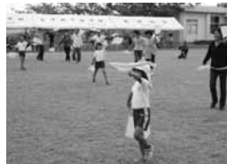
▲古小 シマンチュ全員参加で

古宇利小学校では地域の方々が参加してリレーにエイサーと大忙し。校歌ダンスでは村長も参加して和やかな運動会になった。