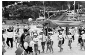
▲天小 龍が舞い、児童が躍動