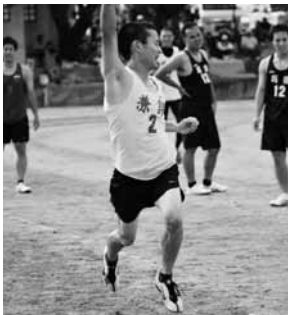
▲一般男子4×400mリレー圧勝