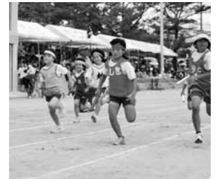
▲小学生リレー女子