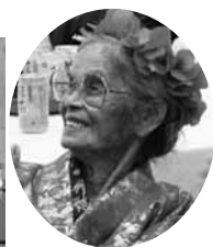
96歳にはみえないチュラカーギー