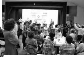
▲安里屋ユンタで踊ろう！共に