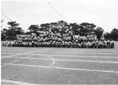
▲今小3・4年生 今帰仁城城壁を表現

台風の影響を受け延期になっていた村内の小学校の運動会は、九月二十四日(土)に古宇利小学校、十月二日(日)に兼次小学校、今帰仁小学校、天底小学校で特色ある運動会が開かれた。