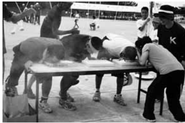
▲童心に戻ってます

は雄大な自然や世界遺産今帰仁城跡の城壁、古宇利大橋、ワルミ架橋などを児童達が全身を使って表現。