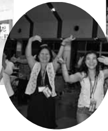
▲カチャーシーは世界を繋ぐ