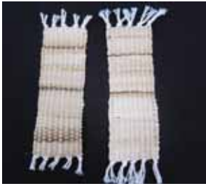
▲ゲットウ織りのしおり