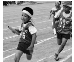
▲小学生リレー男子