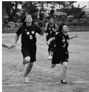
▲年齢別女子4×100mリレー