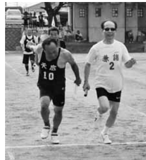
▲年齢別男子4×100mリレー