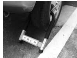
(軽自動車へのタイヤロック実施状況)

本村においても、この一環として、滞納者への徹底した滞納処分を実施し、悪質な滞納者に対しては、自動車のタイヤロックや、沖縄県と協働で差押財産の合同公売を実施します。