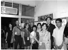
▲再会を願いハイチーズ

ステージでは「かぎやで風」で幕開け、「ひやみかち節」、北山高校・今帰仁中学校の生徒による「北山の風」など多くの余興が披露された。最後に「安里屋ユンタ」を出席者が入り混じって踊り、会場出入口まで地元参加者で花道を作り、再会を誓い合い見送った。