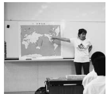
▲カナダでの生活習慣を伝える