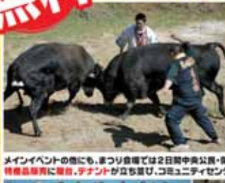
メインイベントの他にも、まつり会場では2日間中央公民館・保健センターを中心に健康に関することや工芸・絵画・書道等を展示。特産品販売に賛同、テナントが立ち並び、コミュニティセンターでの琉球舞踊や、日曜日には運天港で沖釣り大会もあります。