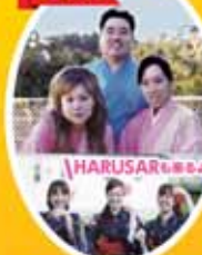
[琉球芸能 朗舞〜い] [琉球ショー] 10月23日(日) 19:00~19:30(まつり会場)