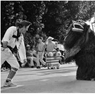
今泊区(道ジュネーより)