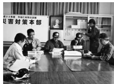
無線による現地対策本部との通信