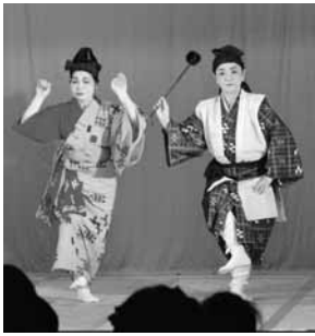
謝名区(加那ヨ一天川)