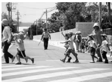
保育園から避難指定地へ