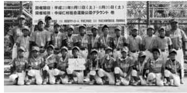
▲優勝したミラクルキッズ

去る八月十三日(土)・二十日(土)に今帰仁村総合運動公園サブグラウンドをメイン会場に第二回今帰仁城址杯少年野球大会が開催され、本島北部・離島から十二チームが参加。予選リーグで勝ち上がった4チームが二十日の準決勝(一位通過組)に進み、ミラクルキッズ対宮里ブレイブスが対戦。4対2でミラクルキッズが勝利し、今帰仁ジュニア対東江少年野球団は2対3で東江少年野球団が勝利し、決勝戦は