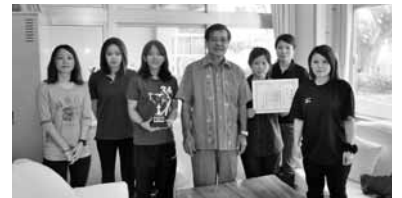
▲なちじん御神達が全国へ

去った七月十日(日)に第五十七回沖縄県青年大会が開催され、村青年会を代表し結成した女子バレーボールチームが優勝。報告を兼ねて村長室を訪れ、第六十回全国青年大会バレーボール大会派遣への協力依頼を行った。全国大会は、東京都江戸川区総合体育館ほか3会場で開催される。