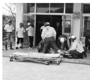
負傷者の応急処置のようす