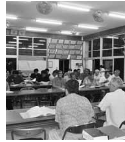
▲越地区での行政懇談会のようす

する形で懇談は進められ、国民健康保険税に関する事、健康づくり、道路整備・防災関連の質疑が多く出された。