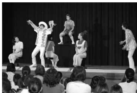
▲「エンとカラとブン」を生の演奏で