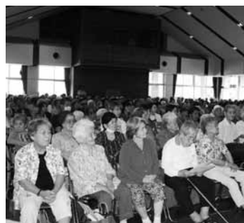
いつまでも元気でね!