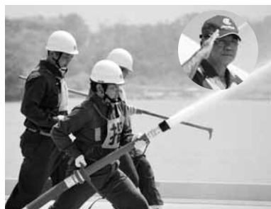
小型ポンプ操法で2位に入賞した本今消防団