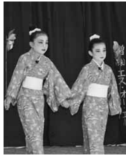
上運天区(花ぬかじまやあ)