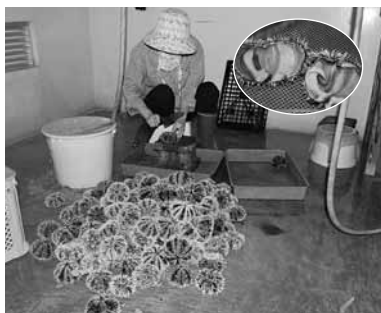
▲朝一採りたての新鮮なウニ

してはいけない貝やエビ、海藻類がありますので、みんなで水産資源を大切にしてくださいませ。