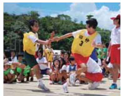
▲みんなの思いをバトンに込めて

の保護者が足を運んでいた。生徒達は躍動感あふれるダンスにエイサー、伝統芸能、総力リレーにさわやかな汗を流した。父母会対抗リレーでは子どもたちに負けじと力走。怪我なく無事に走り終えた。