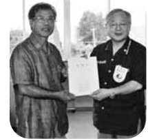
▲與那嶺村長と湧川団長