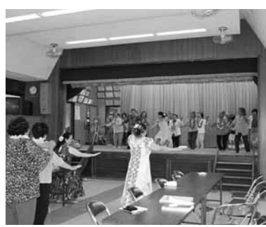
▲ブルメリアの皆さんと渡喜仁の元気なおばあ達