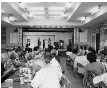
▲おじい、おばあ 見ていてよ!

区民交流会では乾杯に始まりギター演奏、北山亭メソッドによる落語、フラダンスに婦人会の余興などで楽しい時間を過ごした。