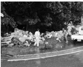
▲厳しい罰則もありますよ!