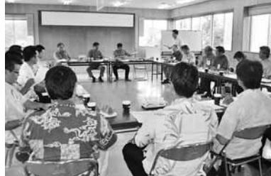
▲地域経済活性化に県産品を！