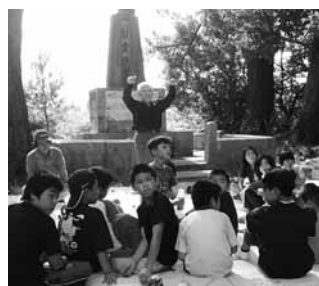
▲防空壕のあった森を指さし、ふり返る児童たち。