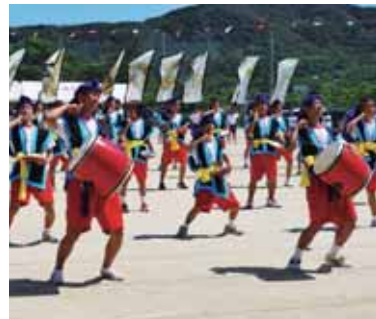
▲声高らかに激しく舞う