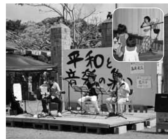
▲ライブに読み聞かせ等、多くの人が訪れた。

六月二十三日(木)慰霊の日「第二回平和と音楽の集い」が平和と音楽の集い実行委員会主催により開催された。DVD上演やライブステージ・子供向けの読み聞かせタイムなど数多くの反戦平和への取り組みが展開された。