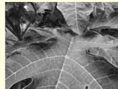
葉脈に赤紫のすじがある