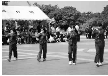
▲4人が力をあわせ演技

沖縄海洋博記念公園主催による第二五回海洋博公園マーチング・バンドフェスティバルが海洋博公園噴水広場にて開催された。小中高生、一般を合わせて三十一団体、九百二十四名が参加。今回初めて村内の天底小、今帰仁中、北山高の3校が揃っての参加となった。