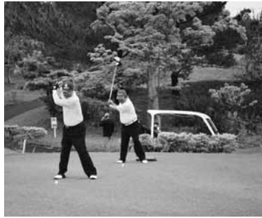
▲村長(左)と渡慶次実行委員長の始球式

オリオン嵐山ゴルフ場にて四月二十六日(火)【午後スタート】・二十七日(水)の二日間にわたり、小雨のぱらつく中、二百二十名の参加者がプレイを楽しんだ。今回のチャリティティーゴルフは、収益金の半分を東日本大震災被害者へ日本赤十字社沖縄支部を通じて義援金として送られる。