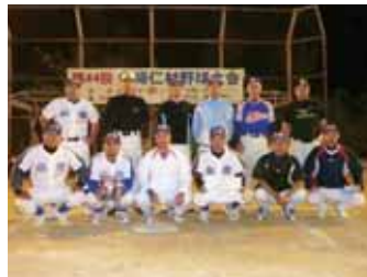
▲優勝した野球小僧チーム

四月十日(日)から村体育協会の主催の第四十四回野球大会が、運動公園サブグラウンド他2会場で熱戦を展開。二十三日(土)の決勝戦は、本今消防野球部と野球小僧が対戦。3対3のまま延長特別ルールで8回表本今消防は無得点に終わり、その裏野球小僧が得点しサヨナラ勝ちした。