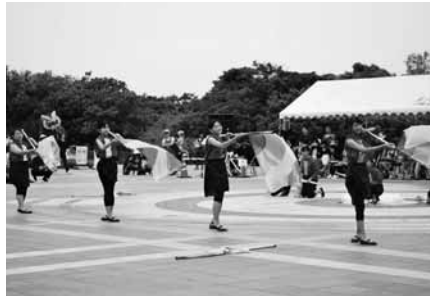
▲音楽に合わせて表現・演舞した今中吹奏楽部のメンバー

カラーガード、ボンボンベツプアーツ部門で今帰仁中学校吹奏学部の九名が参加。今年一月から取り組み、このフェスティバルに照準を合わせてきた。