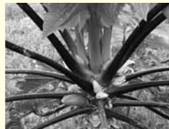
葉柄が濃い赤紫色である