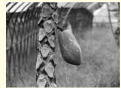
実の軸の部分が赤紫色である