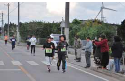
▶ ロードレース大会