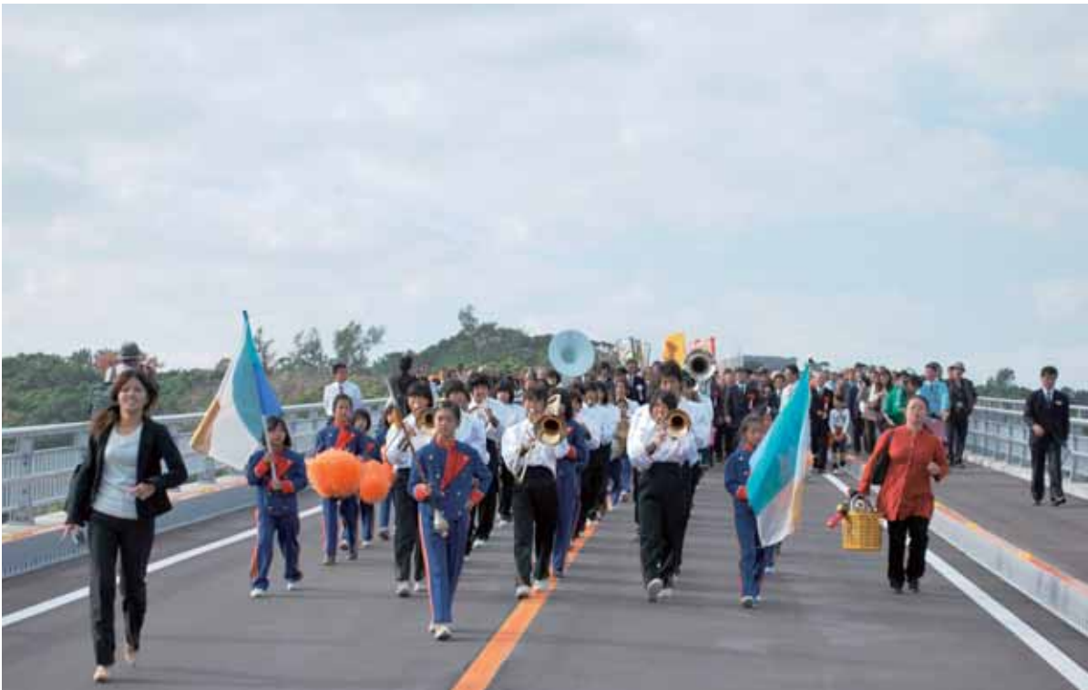
▲天底小学校、今帰仁中学校、吹奏楽隊を先頭に渡り初めが行われた。

本村天底区と名護市屋我地島を結ぶワルミ大橋(全長三百十五M)が十二月十八日、開通した。同大橋は平成十六年に着工。事業費は約三十三億円。合成鋼管アーチ巻立工法によるコンクリートアーチ橋としては国内最長を誇る。