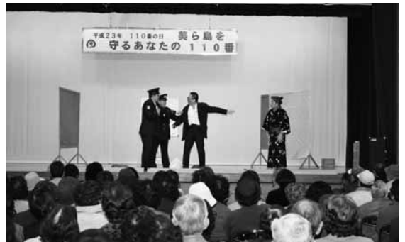
▶署員らによる沖縄芝居

沖縄芝居は、一人寂しく暮らしている「おばあ」の家に悪徳訪問販売員が押し掛け、問答の末、なんとか一一〇番し、警察官が駆け付けるまでの様子をコミカルに上演。 芸達者な署員らの芝居に会場は爆笑の渦に包まれた。