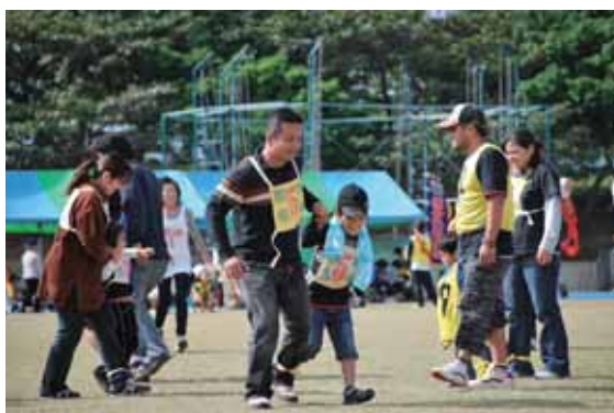
▲親子二人三脚を楽しむ参加者

スポーツを楽しみながら会員相互の親睦を深め、健康で幸せな家庭生活を培うことを目的に、第三十二回今帰仁郷友会大運動会が十二月五日、浦添市総合運動公園陸上競技場で行われた。