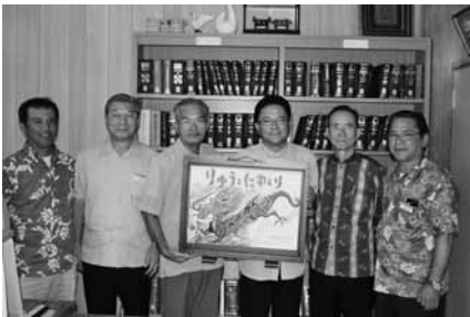
▲寄贈された紙芝居「りゅうとにわとり」