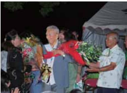
▲かつての教え子から花束をもらう新城氏(中央)