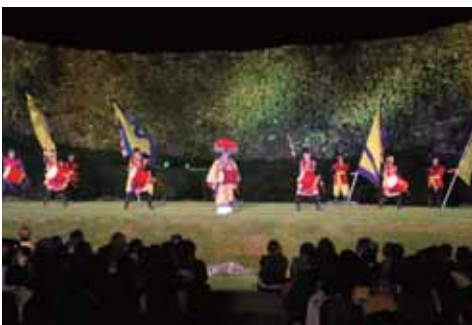
▲いまじん太鼓のエイサー