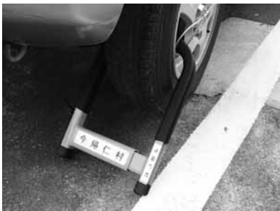
(軽自動車へのタイヤロック実施状況)

期間中は、福祉保健課と連携し、村税及び国保税滞納者への夜間戸別訪問を行い、自主納付の推進に向けた取り組みを行います。