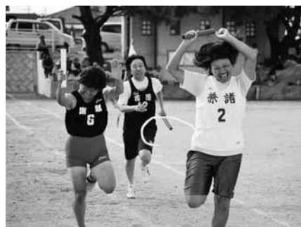
▲女子年齢別リレー