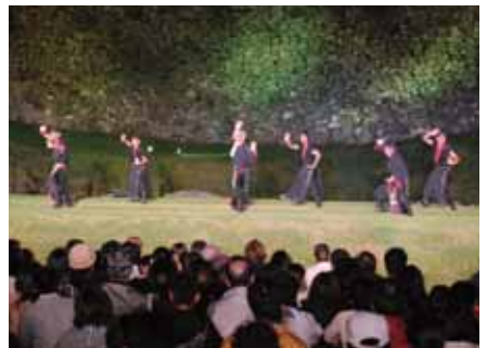
▲劇中に踊られた「国頭サバクイ」