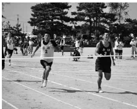
▶ 一般男子 400M