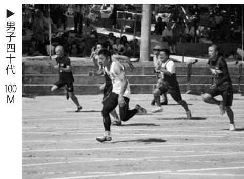
▶ 男子四十代 100M