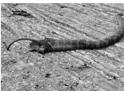
▶ネズミをくわえたままのヒメハブ