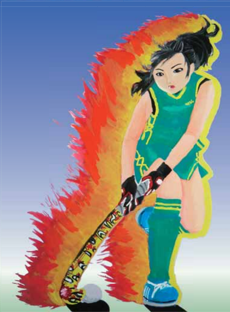
ホスター 園楽 / 菊池 悠 (沖縄県立北山高等学校)