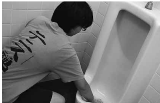
▶男子用小便器に手を入れて磨く生徒

作業を終えた生徒たちの顔はどれも充実感と達成感に満ちあふれ、「便器磨き」で心もピツカピカになったようだ。