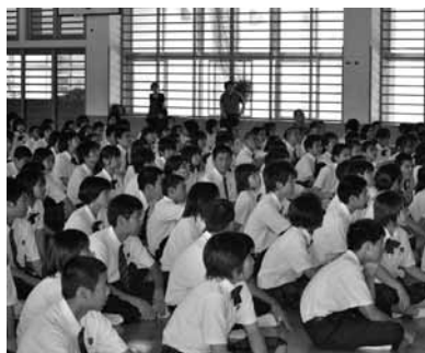
▲講演に耳を傾ける生徒ら

講演会には今帰仁中学校生徒だけでなく、保護者や兼次小学校五・六年生も特別に受講した。