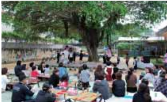
▶ガジュマルの下のステージでカチャーシーを踊る園児と職員ら

なお、新しい今帰仁保育所は、子育て支援センターとともに旧今帰仁中学校に新築され、九十名の園児たちが元気によく遊んでいる。