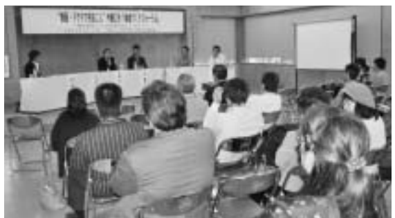
▲活発な論議が展開された公開討論

の協力を得ながら今帰仁映画村を創出して、ロケ地のメッカリにしたい。映画・ドラマ撮影誘致で今帰仁村を盛り上げていきたい。」と意気込んだ。