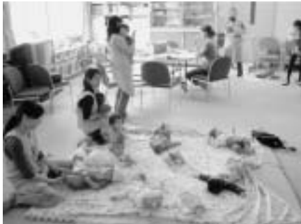
離乳食実習での託児の様子

母子保健推進員の辞令交付式が四月十五日、村保健センターで行われました。今年は兼次、連天の二カ字で推進員の交代がありました。母子保健推進員は各担当地区の妊産婦や乳幼児のいるお母さんへ、家庭訪問や電話で乳幼児健診の受診勧奨、育児教室等の案内をしています。また、乳幼児健診時の身体測定、離乳食実習、育児教室(ピアママ教室)等の託児を行っています。母子保健推進員は、あなたの地区のお助けママです。現在妊娠中の方や育児中の方で、困っている事や心配な事がありましたら、お気軽に声をかけてください。