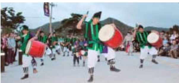
▲渡喜仁青年会のエイサー