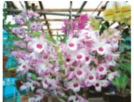
見事に花を咲かせるデンドロビウム

四月初旬から五月初旬までは草丈が百五十センチもあるデンドロビウムが見ごろを迎える。興味のある方は090-4341-7698まで。