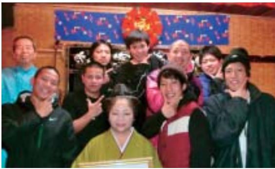
▶優勝したちゃんぶるーチーム