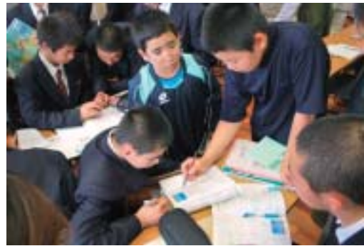
▼わきあいあいと授業が進んだ

全員が問題を解けるようにすることを目標に設定した授業では、昨年五月ごろから「学び合い」の授業を実践している兼次小六年生が今帰仁中学校へ出向き、算数の授業を展開。今帰仁中一年生は数学の授業を展開した。分かる人が分からない人に教えたり、異学年授業の特徴でもある上級生が下級生に教える、またその逆の場面も見られた。