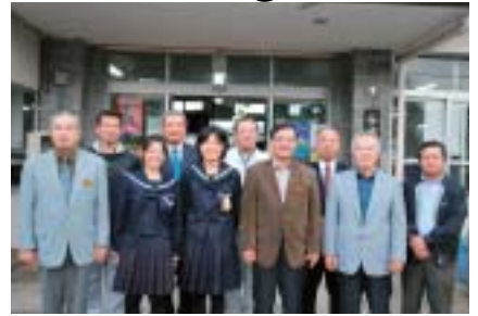
▲女子ホッケー部代表と関係者ら

一月二十二日から長崎県で行われた九州選抜ホッケー競技大会で北山高女子ホッケー部が三位に入賞し、三月二十五日に岐阜県で開催する全国大会への出場が決まった。