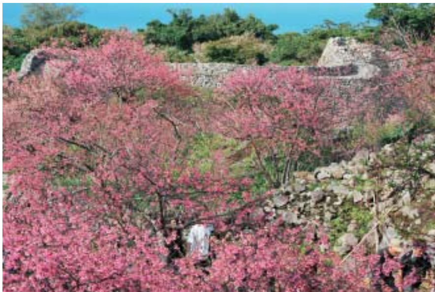
▲城跡内に咲き乱れる寒緋桜