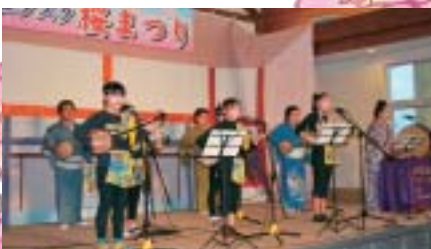
▲ワンカラ・ワンカラの民謡ショー