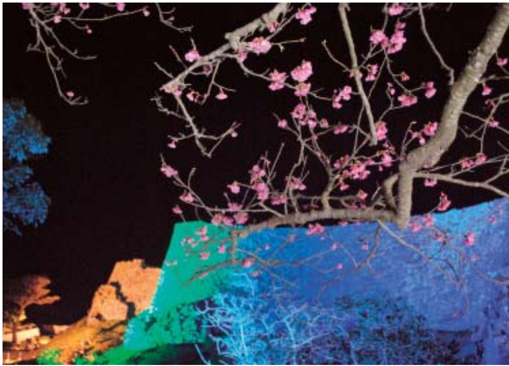
▲桜と城壁のコラボレーション

一月二十二日のオープニングセレモニーを皮切りに二月七日までの十七日間、第三回今帰仁グスク桜まつりが今帰仁城跡で行われた。