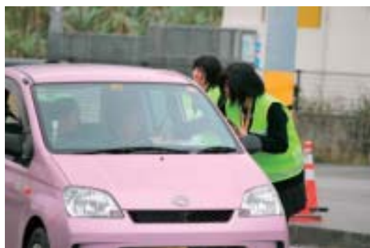
▶チヨココを配布する女子ホッケー部員

部員たちは冷たい雨が降る中、信号待ちの車に飲酒運転根絶を訴えながらチヨココとビラを配布。「寒かったけど楽しかった。」や「飲酒運転がなくなるとういいですね。」と感想を話した。