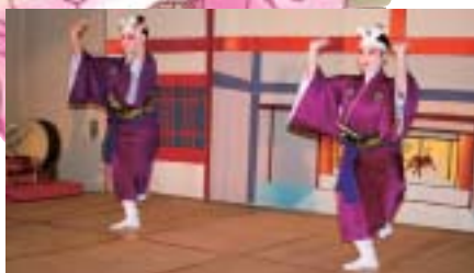
▲まるまぶんさん節