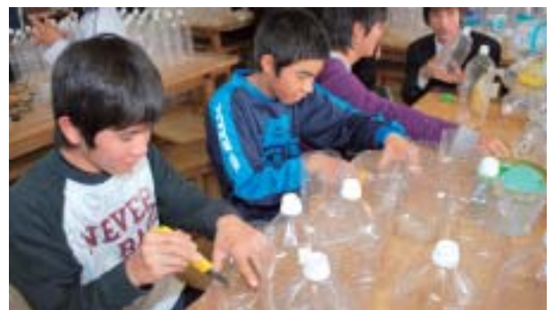
▶ペットボトルの灯籠は中学生と村青年会によって製作された