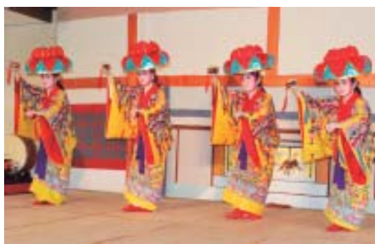
▶琉球舞踊の中でも県外の方によく知られている四つ竹