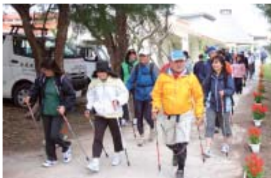
▶景色を楽しみながら村運動公園く城跡のコースを歩いたノルディックウォーキング