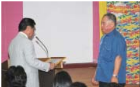
▶表彰された小那覇区長