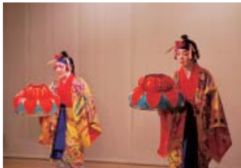
▶ 高い技量で観客を魅了した「伊野波節」

会場は立ち見が出るほどの盛況ぶり、洗練された芸術に惜しみない拍手が送られた。なお、収益金は今帰仁村を通して、村教育委員会へ全額(四十万八千円)が寄付された。