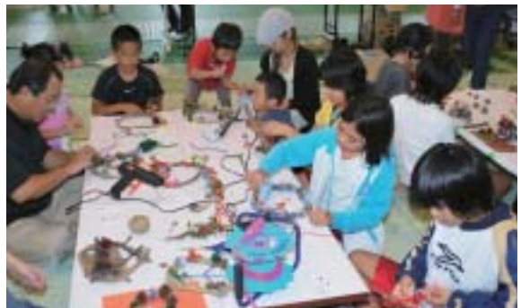
▶親子でクリスマスリース作り

秋の穏やかな陽気に誘われ、小さな子どもからお年寄りまで多くの村民が参加し、気軽にできる催しで、運動公園は活気に満ちあふれた。