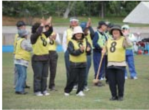
▶ホールインワンを達成して大喜び

今回は今帰仁中学校の生徒五十名余りが部活動での派遣費用造成の一環としてバザーを行い、ヤギ汁、手作り菓子などを販売した。また、吹奏楽部の生演奏や補助役員でも活躍し、運動会を盛り上げた。