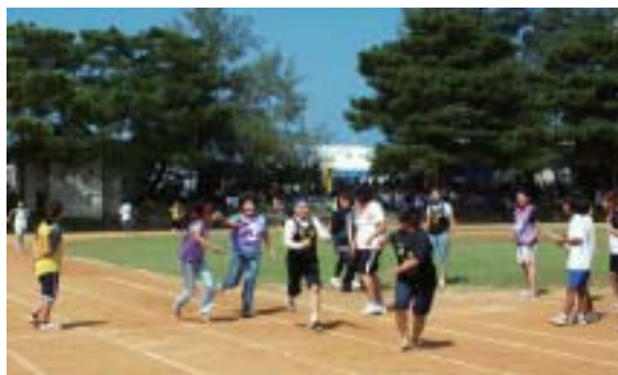
▶ 婦人会による各字対抗リレー

競技は、お馴染みの玉入れ競争やホールインワンゲーム、小学生リレーなど様々な種目を行い、参加者らはさわやかな汗を流し、スポーツの秋を満喫した。