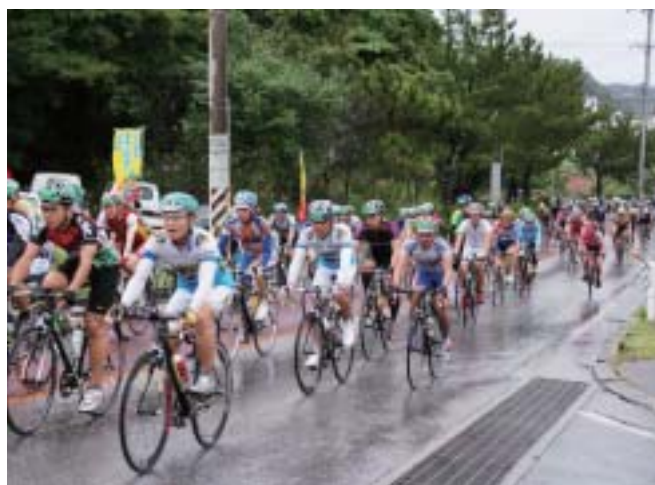
▲雨の中、懸命にペダルを踏む選手ら(山岳びら付近にて)

「熱帯の花となれ、風となれ」をテーマにしたツール・ド・おきなわ2008(ツール・ド・おきなわ協会、北部広域市町村圏事務組合主催)が十一月九日、名護市民会館前を発着点に早朝から開催された。 雨が降る厳しいコンディションの大会となったが、沿道からは傘をさした多くの村民が、懸命にペダルを踏む選手らに温かい声援を送った。