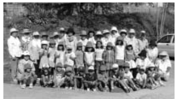
▲みやび花クラブメンバーと兼次小児童たち