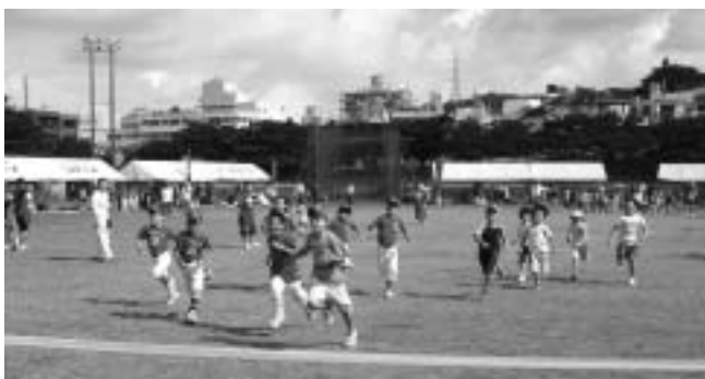
▶ ゴール目指して一生懸命走る小学生