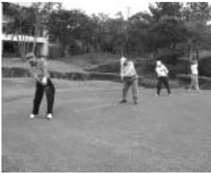
百周年記念大会に花を添える始球式

今大会も多くの方々の寄付金や賞品の寄贈があり、収益金の一部（三十五万円）が「文化・スポーツ子ども育成基金」として積み立てられた。