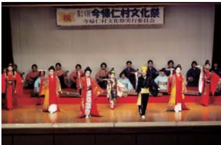
▲観客を魅了したかぎやで風

「共に興さな文化むら今帰仁」をテーマに第二十六回今帰仁村文化祭が十月二十五日、二十六日の二日間、村コミュニティセンター、中央公民館、保健センターを会場に盛大に開催された。 村文化協会の各部会などによる書道や絵画などの展示品をはじめ、伝統芸能などといった舞台発表も行われ、村内外から訪れた観客を魅了した。