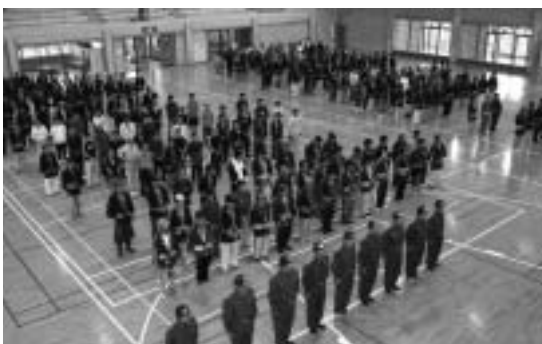
▶ 各字消防団が一堂に会した

「火のしまつ 君がしなく て 誰がする」を全国統一標語に、十一月九日から十五日までの間、秋の火災予防運動週間が全国一斉に行われた。火災予防運動初日にあたる九日は「一一九の日」で今帰仁消防分団と各字消防分団が非常招集され、二百八十九名が村民体育館に参集し、秋季全国火災予防運動特別点検式が行われた。