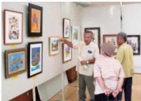
▶ たくさん展示品が並んだ