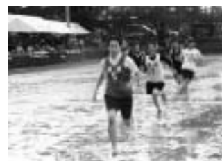
▲女子年齢別リレー