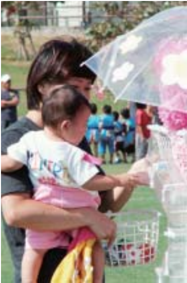
▲お母さんとコロコロボールあそび

二百五十九名の園児たちは、運動会の歌「ガンバリマンの歌」を元気よく唄ったあと、かけっこや親子ゲーム、ゆうぎなどをのびのびと披露した。応援に駆け付けたお父さんやお母さん、おじいちゃんやおばあちゃんたちは、カメラを片手にわが子の元気な姿を見守りながら目を細めた。