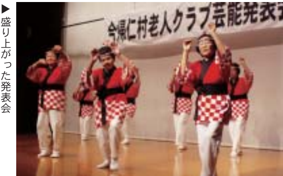
▶盛り上がった発表会

村内の老人クラブのメンバーが日頃練習した芸能活動を発表しようとして十月十日、村コミュニティセンターにて老人クラブ芸能発表会が行われた。各校区別のチーム編成で行われた発表会では、天底校区が舞踊「谷茶前」をアレンジした「ニュー谷茶前」を披露。そのほか、日本舞踊なども披露されるなどバラエティーに富んだ発表会になった。