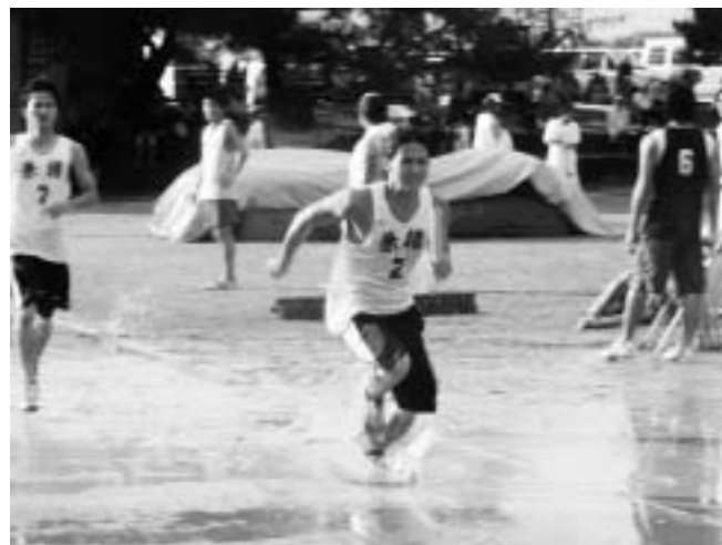
▲本大会のトリを飾る4×400mリレー