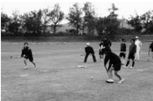
▶ホッケー競技の練習風景