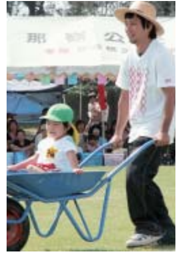
▲「お父さん安全運転でね♡」