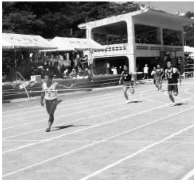
▲村最高記録が更新された40代男子100m