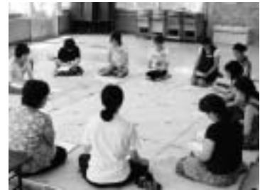
(ピアママ教室の様子)