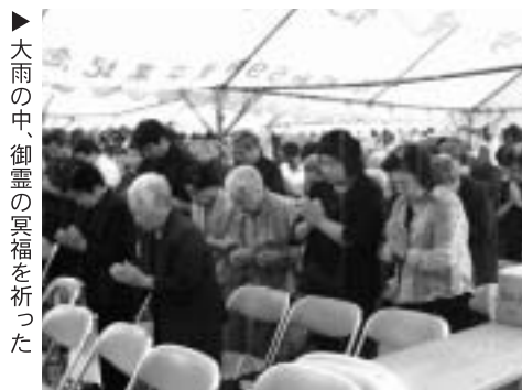
▶大雨の中、御霊の冥福を祈った

村平和祈願祭が多数の遺族関係者の参列のもと、十月七日、慰霊塔で行われ、沖縄戦戦没者の御霊の冥福を祈った。 当日は悪天候にも関わらず五十名余りの遺族らが慰霊塔前に駆け付け、御霊の冥福を祈るとともに二度と悲惨な戦争を起こさないよう不戦の誓いをあらたにした。