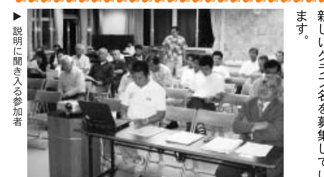
▶説明に聞き入る参加者