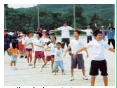
▲まずは体操で体をほぐしましょう