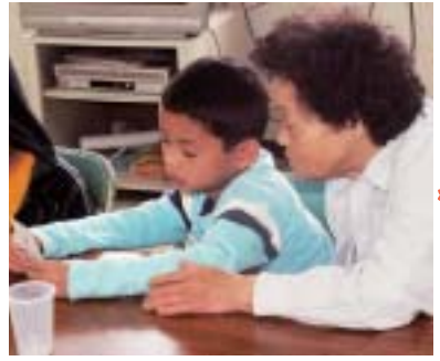
▲ちゃんとできるねー?

「あの子どこの子かね？」という老人会の疑問に答えるため四月二十九日に老人会・子ども会歓迎交流会が行われた。ビンゴゲームやカレー試食で、オジ、オバアと子供たちの距離は一気に縮まった。また、六年生から新一年生へプレゼントも配られた。